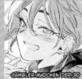
SCHWELF-MICHAL DER SOUJI

ANFÜHRER UND STÄRKSTES KÄMPFER DER SOUJI