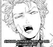
EINZIGER SCHÜLER IN DER SOUJI DER HEIN YAKUZA

NACHDEM SIE IN DEN KONFLIKT MIT DER NACHFOLGERIN DES JINGUU-SUPPLES BEZOGEN WIRD, TRACHTEN IHR PROFESSIONELLE KILLER NACH DEM LEBEN. HONEKO SELBST WISST VON ALLEM NICHTS.