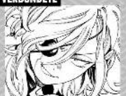
TOCHTER DES JINGUU-BOSSS UND HONEKOS HALBSCHWESTER