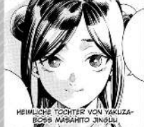
HEIMLICHE TOCHTER VON YAKUZA-BOSS MASAHITO JINGUU