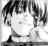
ANFÜHRER UND TACTIKER DER SOUJI

SEIN BRÜDER HAT ARAKUNIS ALTER ALF DEM WISSEN, ALS SCHULDRUCKGESTEN ERHÖHT SIE ARAKUNIS HEIMLICH UNTERSTÜTZUNG.