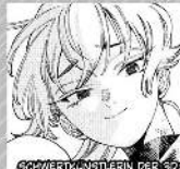
SCHWERTKUNSTLERIN DER SOUJI