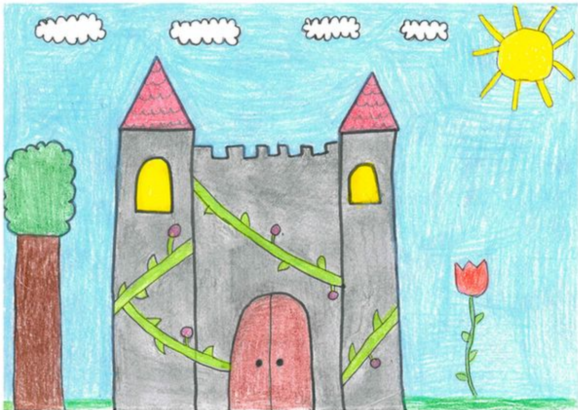
„Ein Sonnentag am Schloss“, Sophie Fritze