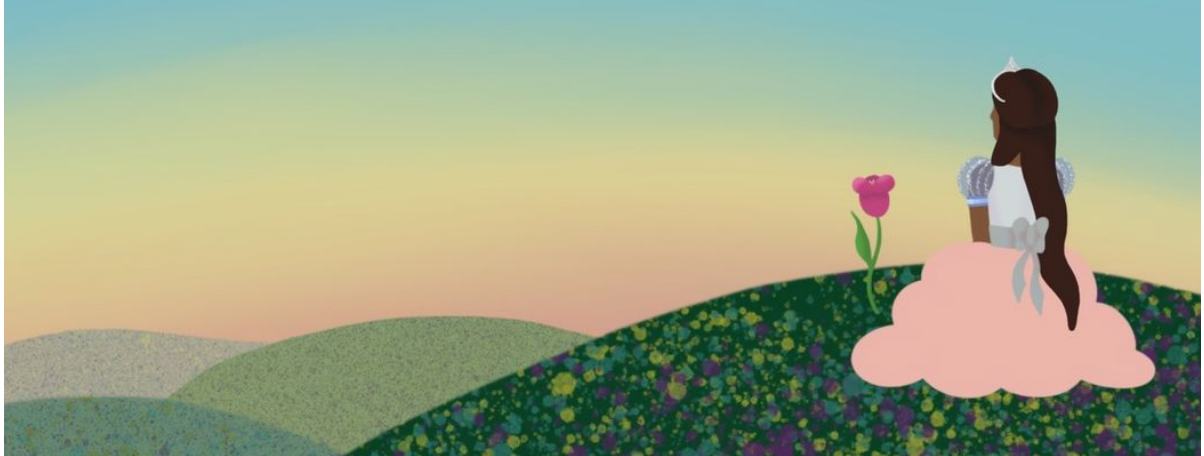
„Die Prinzessin und die Blume“, Phoebe Vogel