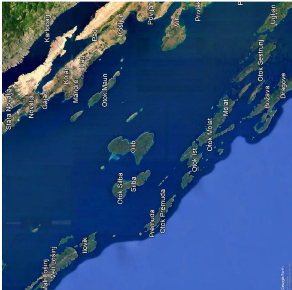
© Google Earth: Archipel von Zadar

Ich erkannte also, dass ich zum einen doch nicht so weit von meinem Ziel entfernt war, zum anderen aber auch, dass ich keine Ahnung hatte, wie ich auf diese gottverlassene Insel gelangen sollte! Denn eines wusste ich schon von meiner Kindheit an – die Insel gehörte bereits damals meiner adeligen Familie: Diese Insel ist ansonsten unbewohnt! Sie liegt zwar nicht so weit entfernt von anderen Inseln, dass nicht Strom, Telefon und Wasser, „neuerdings“ auch Internet dort über den Meeresboden gelegt worden war, aber eine direkte Fähranbindung oder so, gibt es nicht.