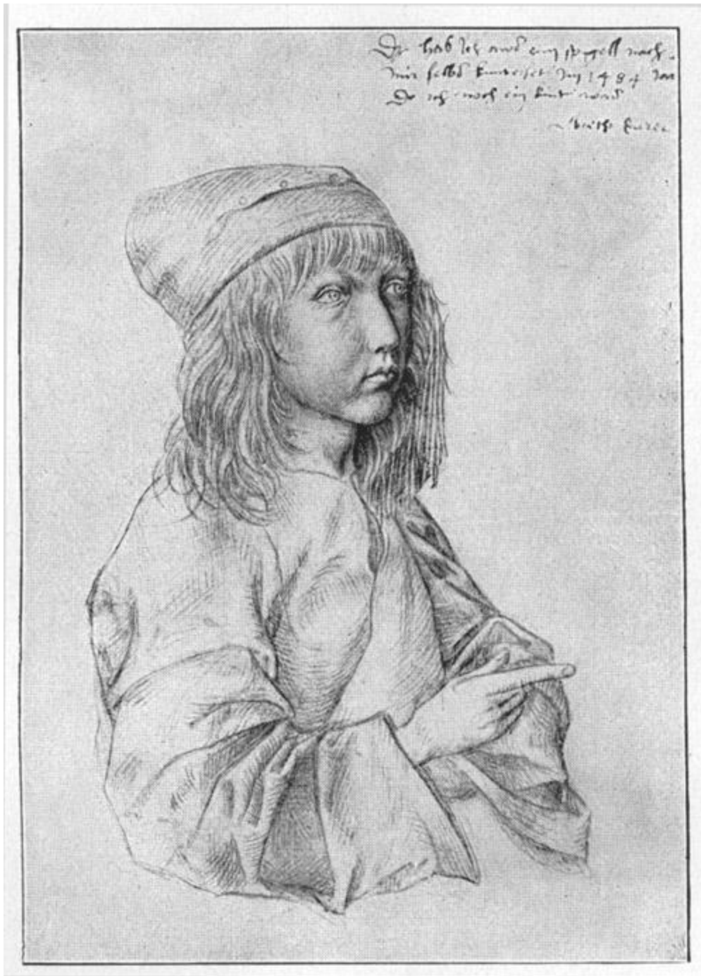
Selbstbildnis Dürers (1484) - Wiener Albertina

Gleichviel wie dem sei: aus dem Giebel- und Hüttenbau, der sich nicht mehr verkriecht in der Landschaft, sondern selbstbewußt sein Bild ihr aufzwingt und damit geologische Arbeit tut, aus diesem Bau heraus ist alles Folgende