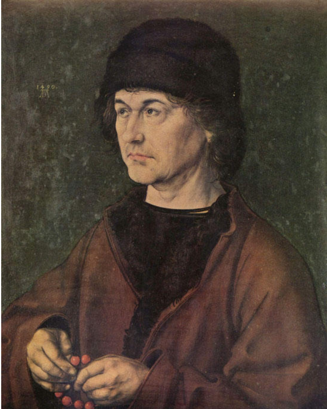
Dürers Vater (1490) - Florenz-Uffizien

Die niedere Welt der Dämonen und des Zauberglaubens leitet wie jede andere Mythologie auch die des Nordens ein. Solche kleinen, engsichtigen Gedanken sind wie eine erste Steppenflora, die ein noch unbebautes Land dem höheren Pflanzenwuchs bereitet. Was die nordische Dämonen- und