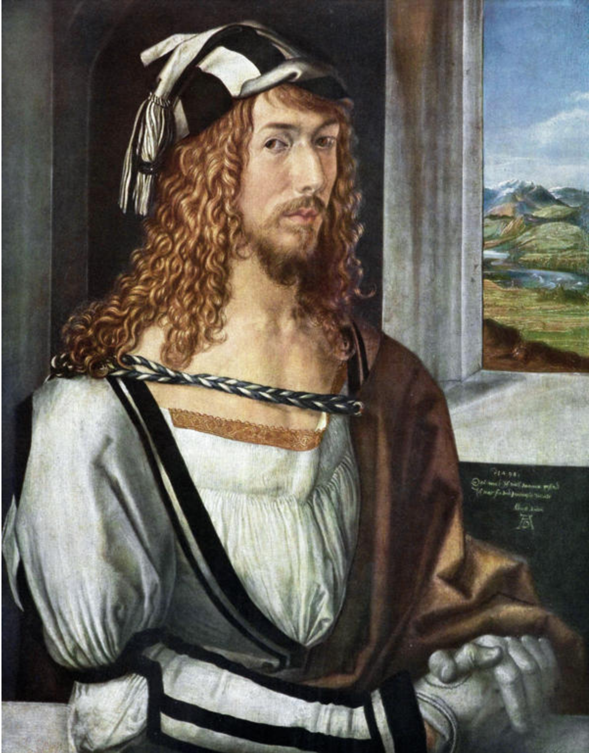
Selbstbildnis Dürers (1498) - Madrid, Prado-Museum