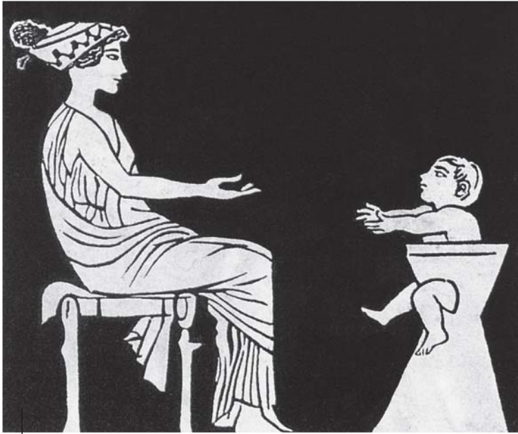
1 | Vasenmalerei, auf der eine griechische Mutter mit ihrem in einem Hochsitz sitzenden Kleinkind abgebildet ist.

Inhalt der Schüssel in den Straßengraben oder die Kanalisation. Da die gefundenen Abtrittschüsseln zu schwach zum Draufsitzen, jedoch als reines Urinal zu groß dimensioniert waren, vermutet man, dass sich eine Sitzvorrichtung mit Loch über der Abtrittschüssel befand. Diese Sitzgelegenheit wird aus Holz konstruiert gewesen sein und im Laufe der Zeit zerfallen sein, sodass heute keine Spuren mehr sichtbar sind. Auch wenn diese Sitztoiletten noch nicht an den Standard von Knossos oder Akrotiri heranreichten, so war der Standard doch beachtlich.