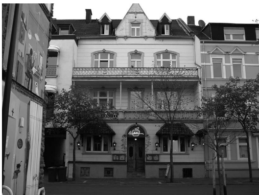
Storchenvilla, Hauptstraße Bad Neuenahr- Ahrweiler: Wohnhaus und Ort des Pensionats von Emma Trosse und Hermine Dulsmann