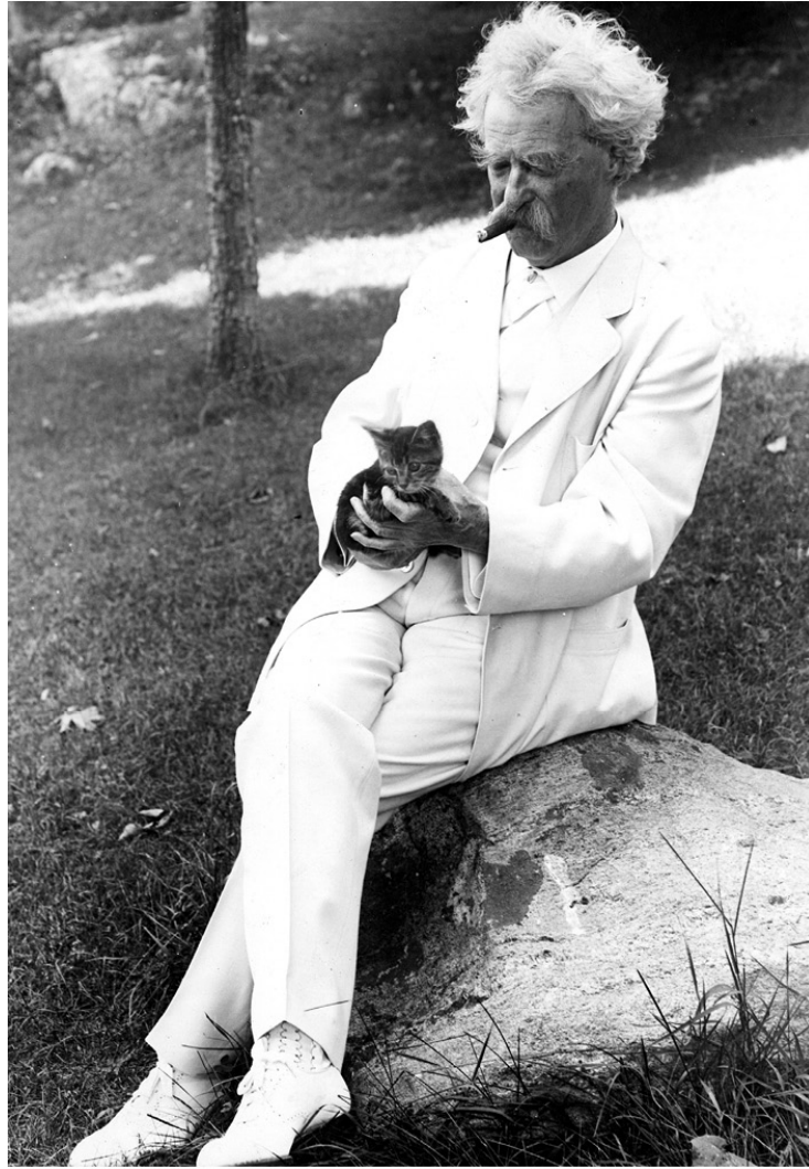
Mark Twain, Tuxedo Park, New York, 1907