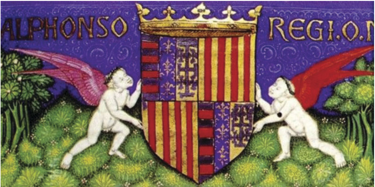
Escudo del Reino de Nápoles que se conserva en la Biblioteca Universitaria de Valencia, de la época en que reinó Alfonso el Magnánimo.

del rey Martín el Humano, que gobernaba Sicilia. Blanca enviudó en 1409 y quedó como regente del reino de Sicilia, pero volvió al poco tiempo a Navarra.