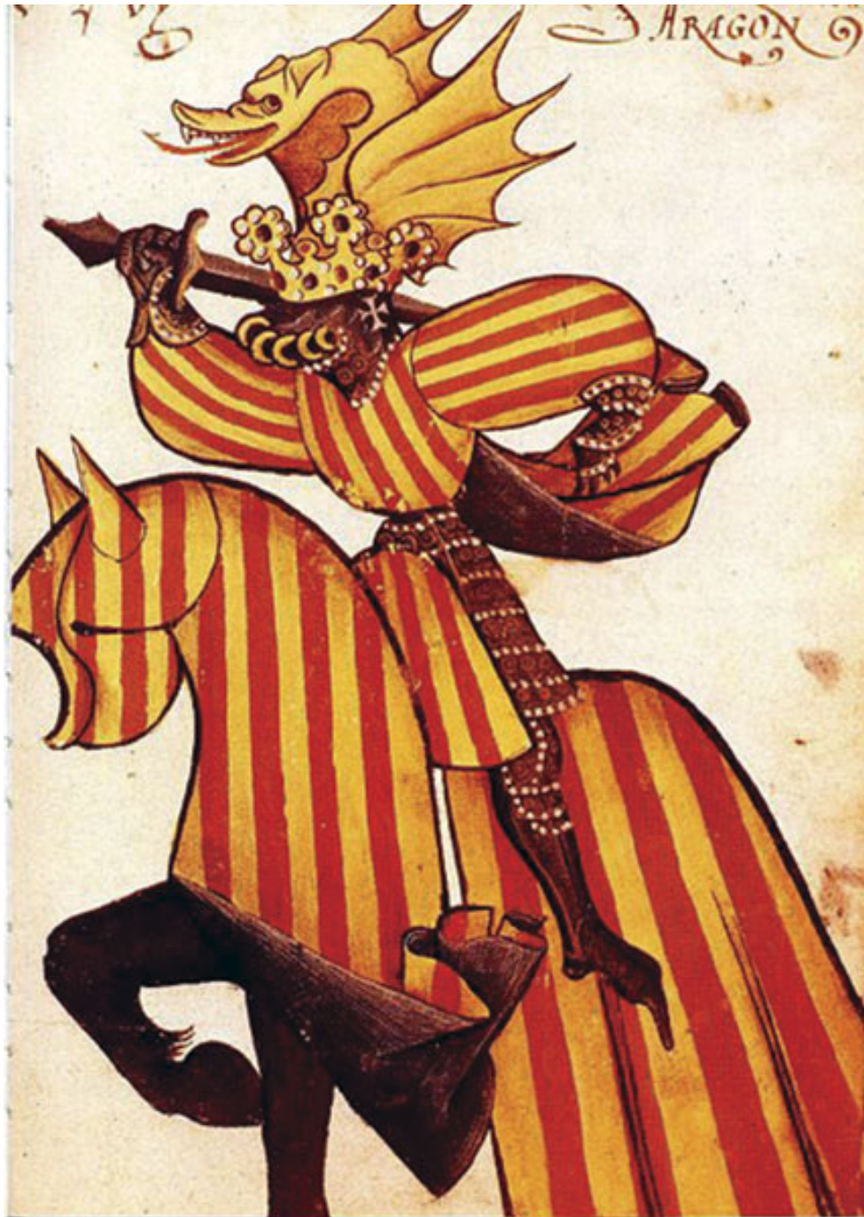
Representación heráldica ecuestre de Alfonso V el Magnánimo con el señal real en sobreveste y gualdrapas del caballo en el armorial ecuestre del Toison d'Or. París (h. 1433-1435).