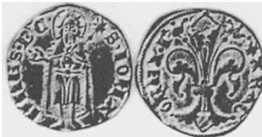
«Florín de Aragón» de Pedro IV el Ceremonioso. Pieza de Oro de aproximadamente 3,42 gramos y ley de 18 quilates. Valor de 11 sueldos aragoneses.