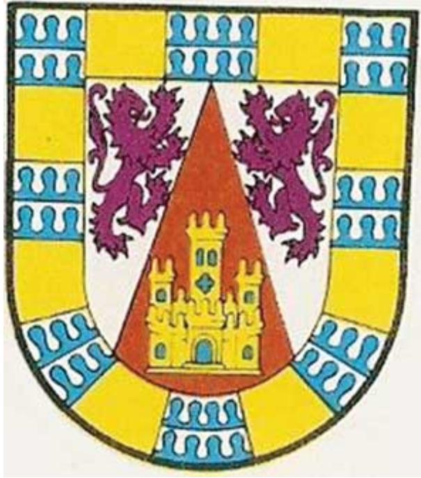
Escudo de armas de Enrique de Trastámara, hijo de Alfonso XI de Castilla.

Enrique inició una política de consolidación de un bloque nobiliario de parientes, que fuera el sostén de la nueva dinastía. Y nombró a su hijo bastardo Alfonso en sucesor de su señorío asturiano, en detrimento del heredero Juan. En total, eran seis mil kilómetros de superficie, en los que se incluían — excepto Oviedo y Avilés— las villas y los concejos más ricos y poblados de la región, es decir, lo que el propio Alfonso Enríquez denominó «mi condado e señorío de Asturias».