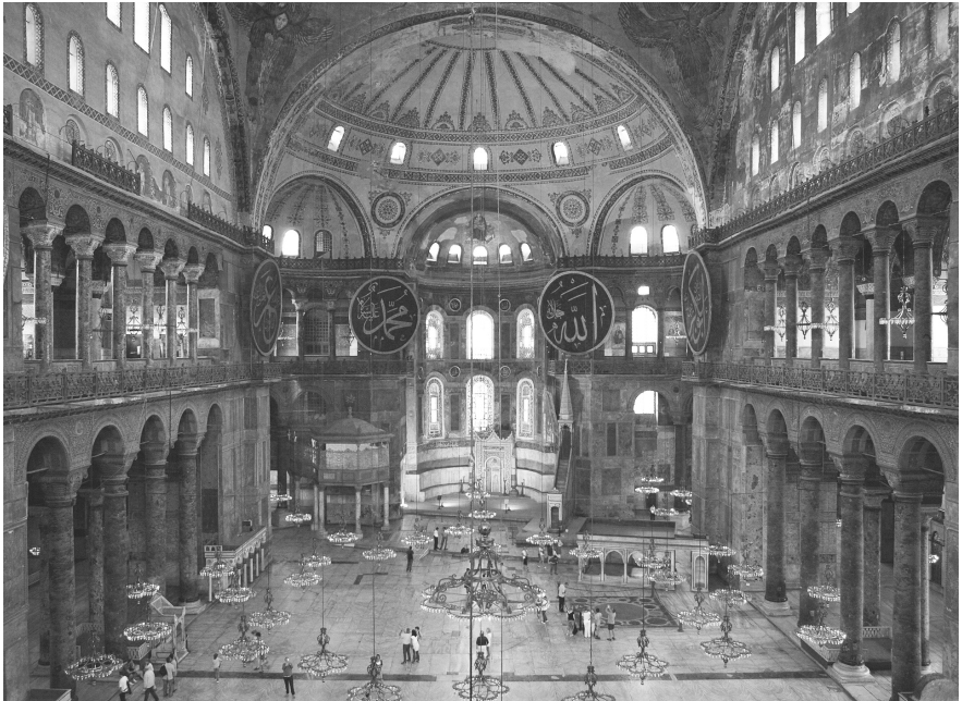
Cúpula de Santa Sofía.

romper con todo lo anterior. Es imposible encontrar un período o estilo artístico de la Historia al que la luz le haya sido ajena. Más aún, pese a la significación y matices propios de cada época, la luz ha sido siempre el material constructivo fundamental en la configuración de la Arquitectura de su tiempo.