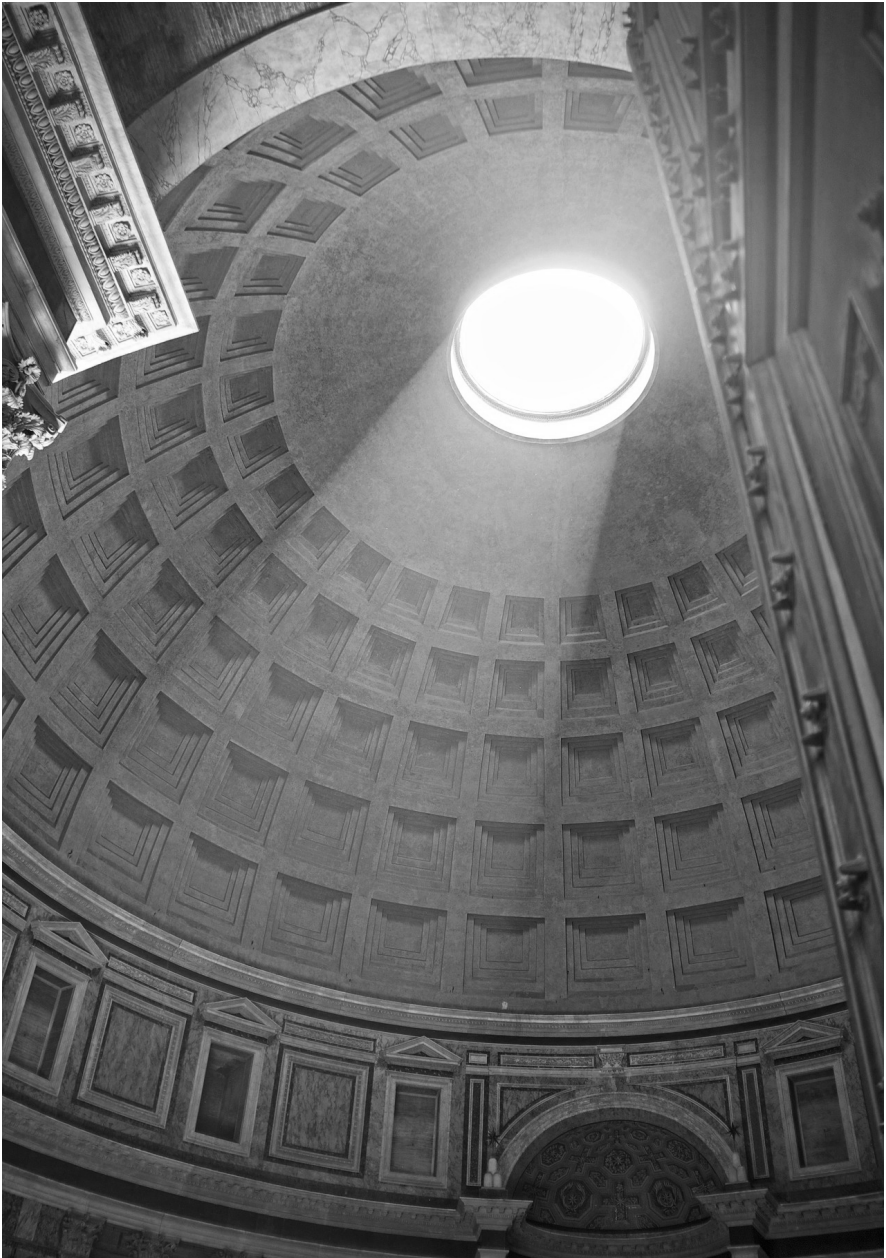
Entrada de luz en el Panteón.