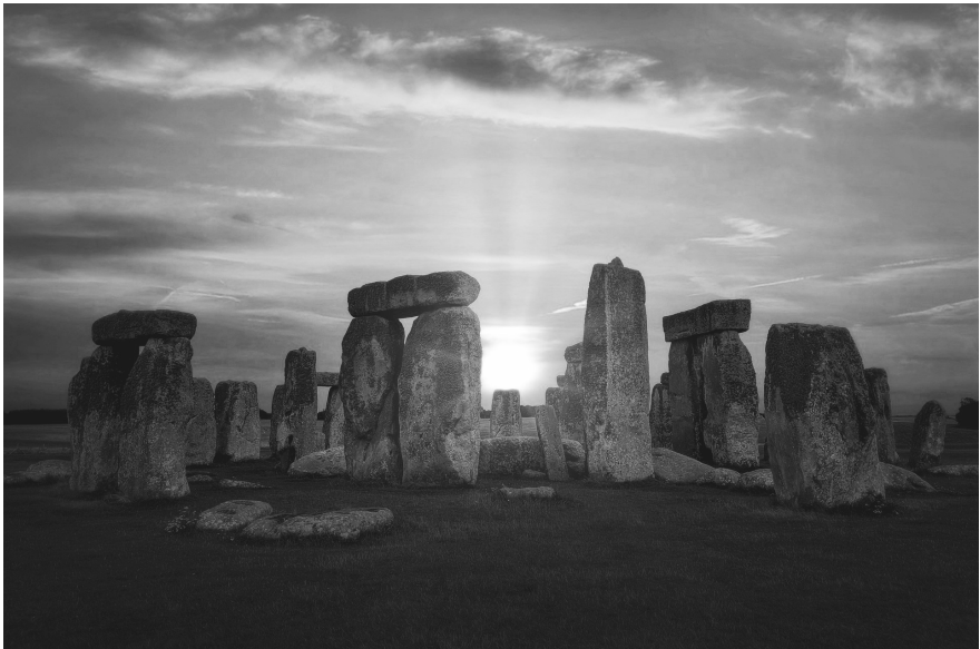
Solsticio de verano en Stonehenge.

Desde las primeras muestras de Arquitectura, ya en la Prehistoria, la luz siempre ha sido la piedra angular en torno a la cual todo lo construido se ha articulado.