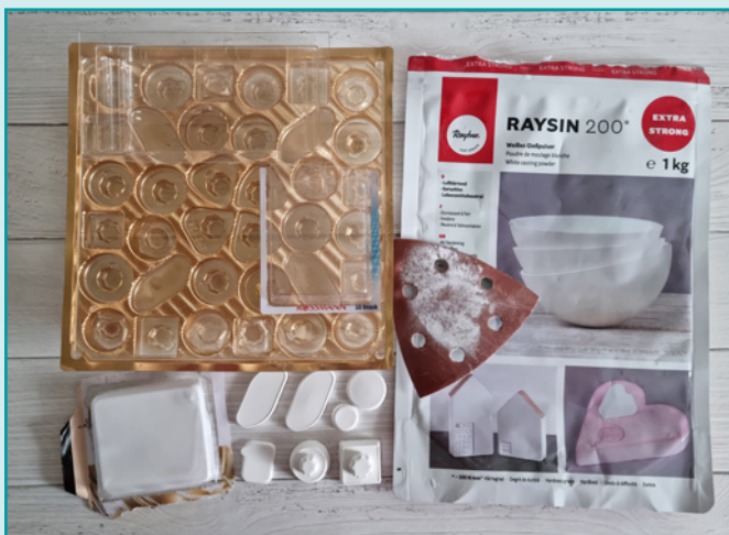
Formen oder Alltagsgegenstände, wie z. B. Pralinschachteln.