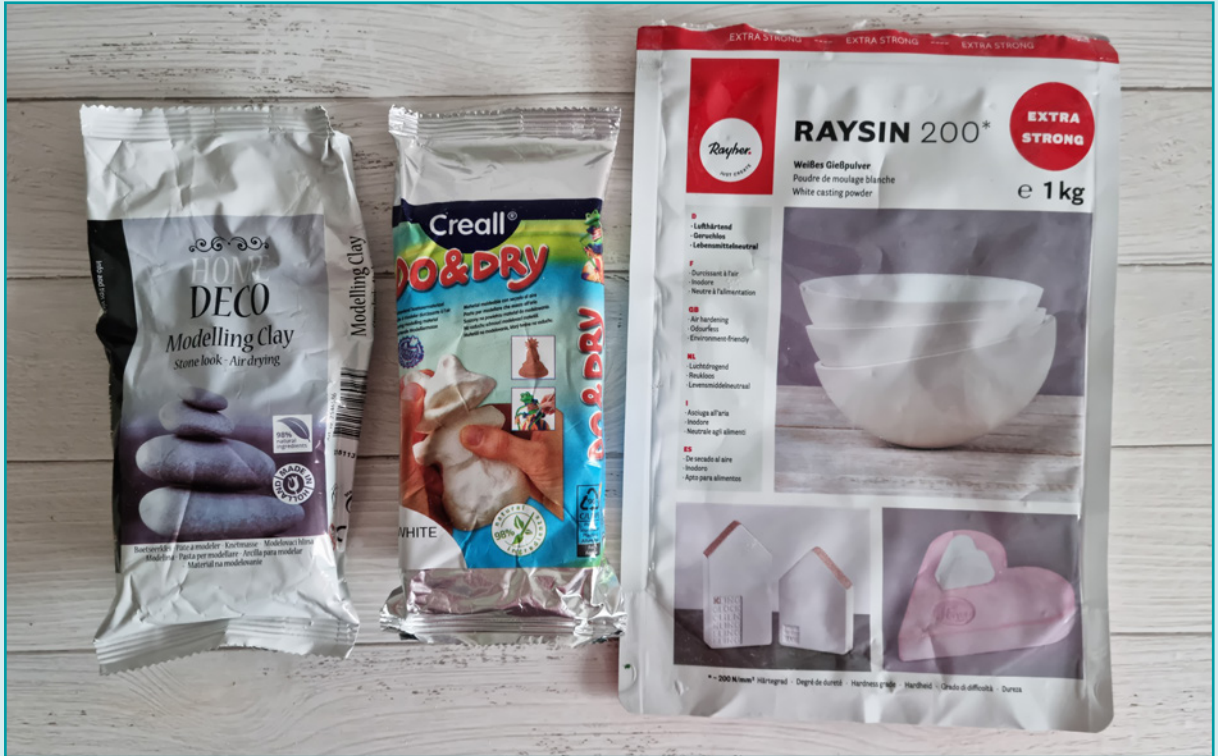
Gießpulver, Modelliermasse in Steinoptik, weiße Modelliermasse.