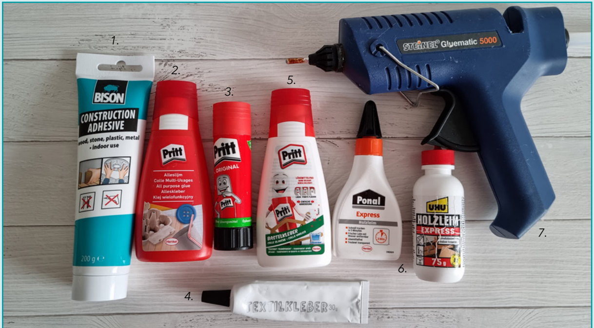
1. Spachtelmasse, 2. Universalkleber, 3. Klebestift, 4. Textilkleber, 5. Bastelleim, 6. Holzleim, 7. Heißklebepistole, nicht auf dem Bild: Superkleber.