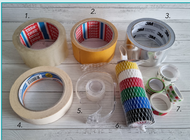
1. Klarsichtband, 2. doppelseitiges Klebeband, 3. Aluminiumband, 4. Kreppband, 5. Tesafilm, 6. Isolierband, 7. Washi-Tape.