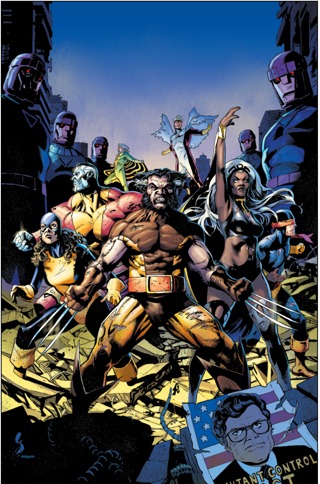
X-Men: Days of Future Past - Doomsday (2023) 1 Cover von GEOFF SHAW