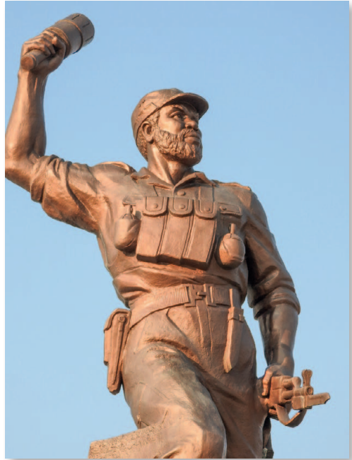
Acht Meter hohe Soldatenstatue am Kriegsdenkmal Heldenacker

Hauptstreitpunkt der kaum zu überbrückenden Meinungsverschiedenheiten, an denen der damalige UNO-Generalsekretär Kurt Waldheim durch nicht gerade optimales Taktieren sicher nicht unschuldig war, war die militärische Entflechtung der Situation. Dieses Problem konnte erst viel später (1988) durch den Waffenstillstand mit Angola und den Rückzug der südafrikanischen Armee endgültig gelöst werden. 10.000 Zivilisten und eine unbekannte Zahl von Soldaten und SWAPO-Kämpfern hatten im 22-jährigen Buschkrieg, der mit unbeschreiblicher Grausamkeit geführt worden war, ihr Leben verloren. Ein innenpolitisch enorm wichtiger Schritt war die Umgestaltung der verfassungsgebenden Versammlung zur Nationalversammlung im Jahre 1979. Eine der ersten Maßnahmen dieser Versammlung war die Verabschiedung des Antidiskriminierungsgesetzes, wodurch die Apartheid abgeschafft wurde. Südafrika konnte sich zwar nach wie vor nicht mit der UNO einigen, es baute aber die Strukturen, die Namibia nach der Unabhängigkeit benötigen würde, weiter aus. Ein wesentlicher Schritt hierfür war die Schaffung eines alle elf Volksgruppen umfassenden Ministerrates aus 12 Personen (je eine pro Volksgruppe und ein Vorsitzender). Damit hatte Namibia de facto erstmalig eine eigene Regierung . Ihr wurde am 14.9.1981 die Regierungsverantwortung übertragen – außen vor blieben Verteidigungs- und Außenpolitik sowie Verfassungsfragen, für die weiterhin Südafrika zuständig blieb. Martti Ahtisaari, von 1977–1981 UN-Kommissar für