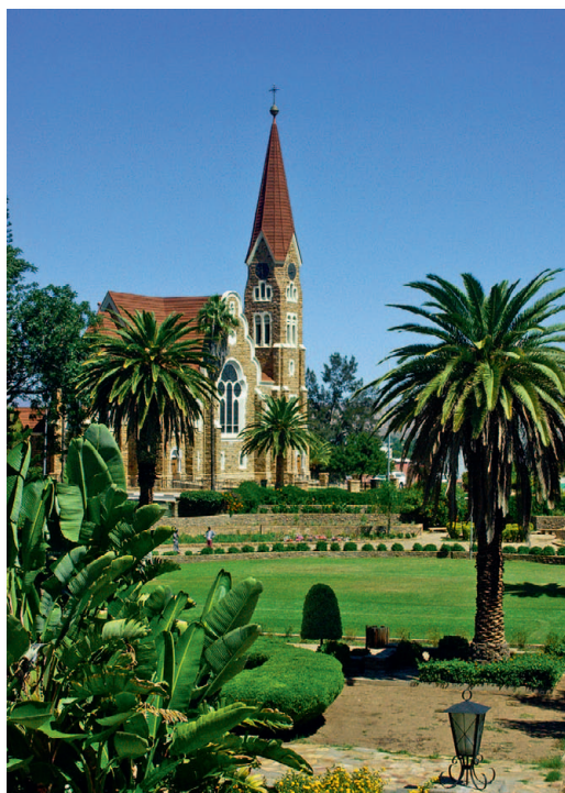
Die Christuskirche in Windhoek (von 1910)

1880 brach der zehnjährige Krieg zwischen den Khoi Khoi und den Herero aus, doch als die Missionare der Rhein-