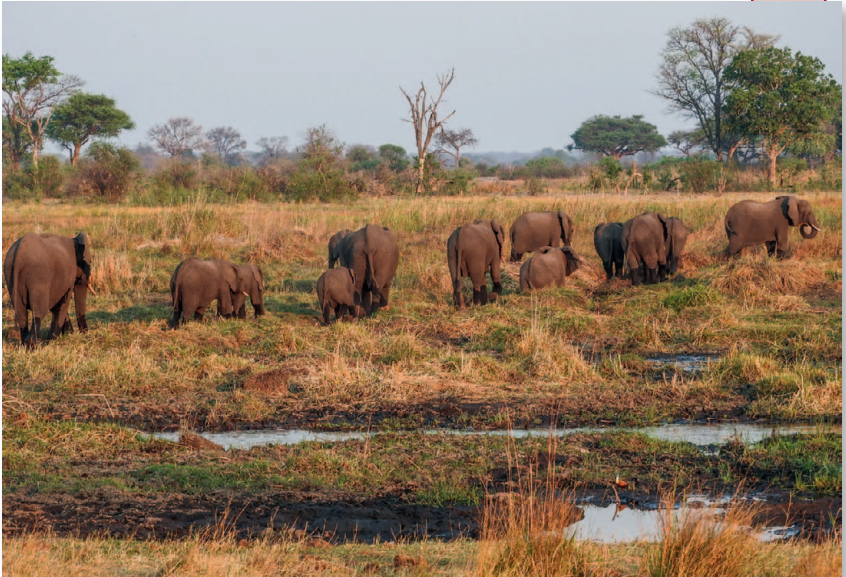
Einen Abstecher oder sogar eine eigene Reise wert: Die Nationalparks im Caprivi-Streifen erinnern mit ihren großen Elefantenherden an den Chobe National Park in Botswana