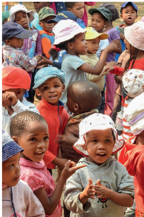
Eine gute Schulbildung für die Kleinsten soll zur Bekämpfung von Arbeitslosigkeit und Armut beitragen

Die Landreform mit dem Verbot des Besitzes mehrerer Farmen bzw. von Großfarmen stößt inzwischen trotz der Bodensteuer auf zunächst nicht erwartete Probleme, denn viele Minister sind ihrerseits Land- und Großgrundbesitzer geworden, was die Motivation zur Umsetzung der Landreform