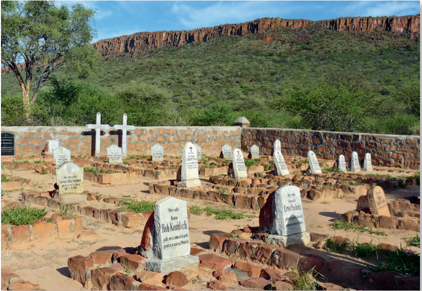
Am Waterberg fand das Massaker an den Herero statt, hier der Friedhof der deutschen Soldaten

später kamen zur Verstärkung frische Truppen aus Deutschland und am Waterberg kam es zur großen Entscheidungsschlacht (s. S. 450).