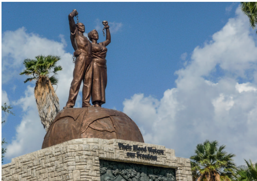
Die Genocide Memorial Statue in Windhoek vor der Alten Feste erinnert an den Aufstand gegen die deutschen Kolonialtruppen

Menschen nichts anderes übrig, als Arbeit auf den Farmen, in den Minen und auf den Diamantenfeldern zu übernehmen. In dieser Zeit entstanden auch die ersten locations , größere Siedlungen in der Nähe der Farmen oder Werften. Hier lebten die Schwarzen fortan ohne stammesmäßige Gliederung.