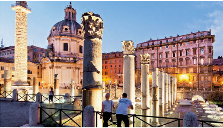
Das Römische Reich ist in Rom allgegenwärtig: Blick in das Trajansforum.

die Römer:innen selbst, die mit dem ihnen eigenen Gleichmut gegenüber der Geschichte immer wieder für moderne Brüche sorgen.