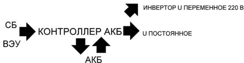
Рис. 1.1. Блок-схема устройства источника питания от солнечной батареи.

Сегодня можно самостоятельно собрать устройство для альтернативного обеспечения солнечной энергией, состоящее непосредственно из солнечной батареи (солнечных элементов, соединенных в батарею), аккумулятора и устройства преобразователя (инвертора) тока – с постоянного в переменный; таким образом иметь дома источник альтернативного питания с сетевым напряжением 220 В. На рис. 1.1 представлена блок-схема устройства источника питания от солнечной батареи.