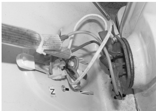
Рис. 1.4. Вид на клеммник, электрические провода и место соединения с нагревательным ТЭНом

мание. Так, на рис. 1.4 представлен вид на клеммник, электрические провода и место соединения с нагревательным ТЭНом (спиралью, спрятанной в многосекционном корпусе масляного радиатора).