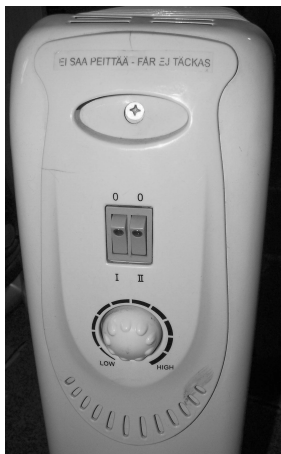
Рис. 1.2. Масляный радиатор со стороны регулятора термостата и клавишных включателей выбора мощности