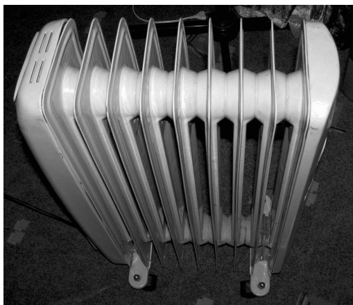
Рис. 1.1. Внешний вид масляного радиатора SMF-9-200F

Это самые популярные и надежные бытовые обогреватели, применяемые для помещений площадью до 30 м 2 . Они мобильны, обеспечивают безопасный и комфортный обогрев и могут использоваться 24 часа сутки. Масляные обогреватели имеют несколько режимов нагрева. Внешний вид масляного радиатора финской фирмы Lеха модели SMF-9-200F (приобретенный автором в Лаппенранта, Финляндия, в 2009 году) представлен на рис. 1.1.