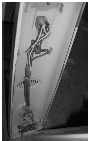
Рис. 1.3. Вид на регулировочный термостат с биметаллическими пластинами

в России общепринятому мнению, будто бы все и везде имеет марку made in China. Очевидно, что это замечание россиян, мягко говоря, не совсем так, или, по крайней мере, совсем не так, если, конечно, почаще выезжать за пределы страны и смотреть мир. В небольших количествах, но все же выпускаются в Финляндии, Бельгии и Германии (где мне удалось побывать в последние 2 года) масляные обогреватели, и цена на них в разы ниже (в пересчете на отечественную валюту), чем в моем отечестве – относительно аналогичного по электрическим и тепловым характеристикам китайского масляного обогревателя.