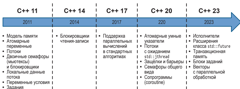
Средства параллельного программирования в языке C++

С выходом стандарта C++ 11 язык получил библиотеку для многопоточного программирования и подходящую модель памяти. Эта библиотека содержит такие строительные блоки, как атомарные переменные, классы для потоков, двоичных семафоров и переменных условия. Они составляют фундамент, на котором в будущих версиях стандарта – например, C++ 20 и C++ 23 – станет возможным определить абстракции более высокого уровня. Однако и в стандарте C++ 11 уже присутствует понятие задания, которое обеспечивает более высокий уровень абстрагирования по сравнению с перечисленными базовыми строительными блоками.