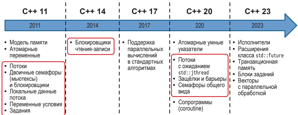
Средства для работы с потоками в языке C++

Средства многопоточного программирования в языке C++ включают потоки, примитивы синхронизации доступа к общим данным, локальные переменные потоков и задания.