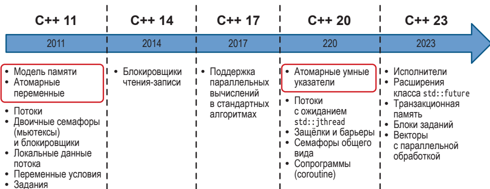
Модели памяти в языке C++

В основе многопоточного программирования лежит чётко определённая модель памяти . В ней должны быть отражены следующие аспекты: