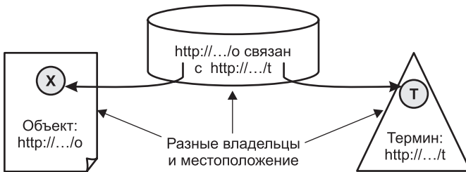
Рис. 1.2 ❖ Веб-архитектура связанных данных

Одна из основных характеристик традиционного веба заключается в том, что веб-контент является распределенным как в смысле расположения, так и в смысле владения им: веб-страницы, которые ссылаются друг на друга, часто размещены на разных веб-серверах, и эти серверы находятся в разных местах и принадлежат разным лицам. Развитие веба основано на принципе «кто угодно может сказать что угодно о чем угодно» 1 , или точнее: любой может сослаться на любую веб-страницу без какого-либо разрешения владельца этой страницы и не заботясь о правильности ее адреса. Аналогичный механизм работает и в сематическом вебе (см. рис. 1.2): одна сторона может опубликовать набор данных в вебе (левая часть диаграммы), вторая сторона – независимо опубликовать словарь терминов (правая часть диаграммы), а третья сторона может проаннотировать данные первой стороны с помощью терминов из словаря второй стороны, не спрашивая разрешения ни у одной из сторон. Более того, первые две стороны могут даже не знать об этом. Именно подобное ослабление связей является сутью паутинообразной природы сематического веба.