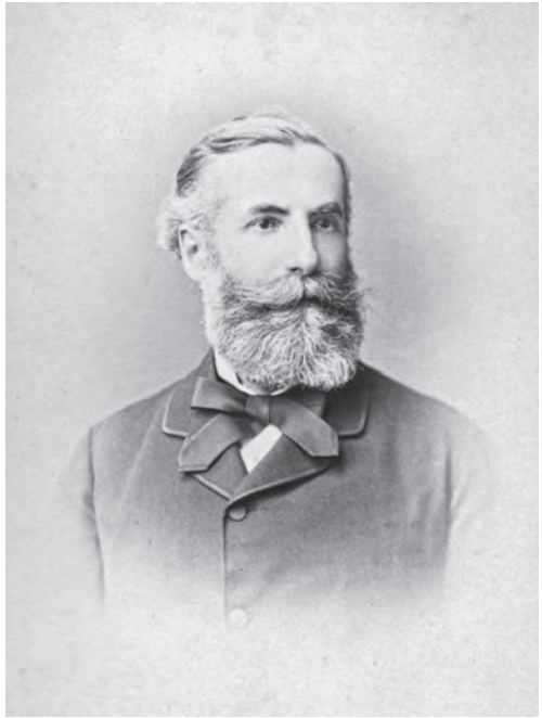
Robert Freiherr Lucius von Ballhausen, um 1880

partei», dem Typus einer Honoratiorenpartei sehr nahe. In den meisten Gebieten gab es zunächst noch gemeinsame Wahlkomitees mit den Fortschrittlern, auch wenn sich in einigen Wahlkreisen schon bald «nationale Vereine» konstituierten.