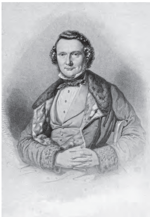
Georg Gottfried Gervinus, Gemälde von Carl Oesterley

ganze Geschäftsführung übernehmen. Wir haben schon ein förmliches Bureau mit mehreren Kanzlisten, Boten, Schreibern etc. errichtet. Die Leitung der Sache ist eine recht gute praktische Übung für mich. Ausserdem ist es sehr angenehm, mit einer grossen Anzahl der hervorragendsten Leute im ganzen Lande – namentlich hier in den sechs östlichen Provinzen – in persönliche Beziehung [zu treten]. Wir werden das Land demnächst mit Ansprachen, kleinen Schriften etc. überschwemmen.