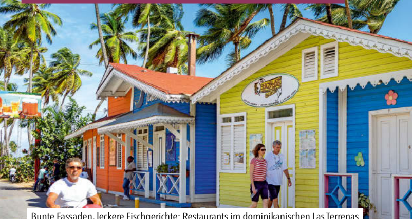
Bunte Fassaden, leckere Fischgerichte: Restaurants im dominikanischen Las Terrenas

Türkis schimmernde Gewässer und von Palmen gesäumte weiße Strände, eine aus den verschiedensten Winkeln der Welt zusammengewürfelte Bevölkerung mit ansteckender Lebenslust und Sinnlichkeit – all das haben die Großen Antillen, die Bahamas und die Cayman Islands gemein.