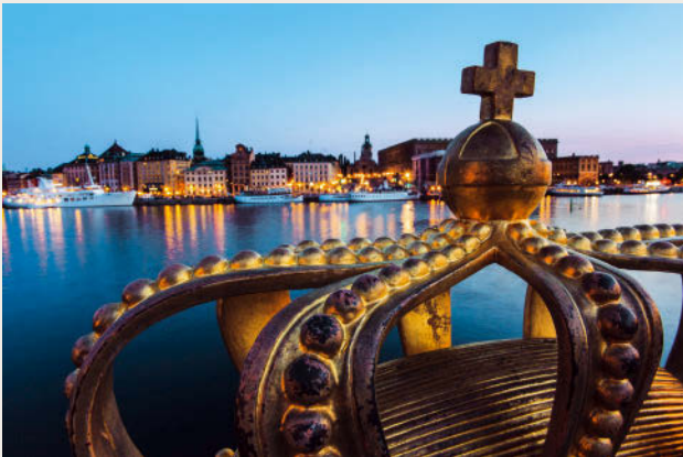
Blick von der Brücke nach Skeppsholmen hinüber zur Altstadtinsel Gamla Stan

Ob Ostsee oder Mälarsee, der Weg zum Wasser ist nie weit. Stockholm ist eine Stadt inmitten der Natur – und ihre Einwohner sind stolz auf den ersten innerstädtischen Nationalpark der Welt.