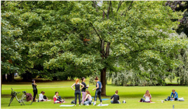
Der Humlegården in Östermalm: Grünflächen gibt es in Stockholm reichlich.