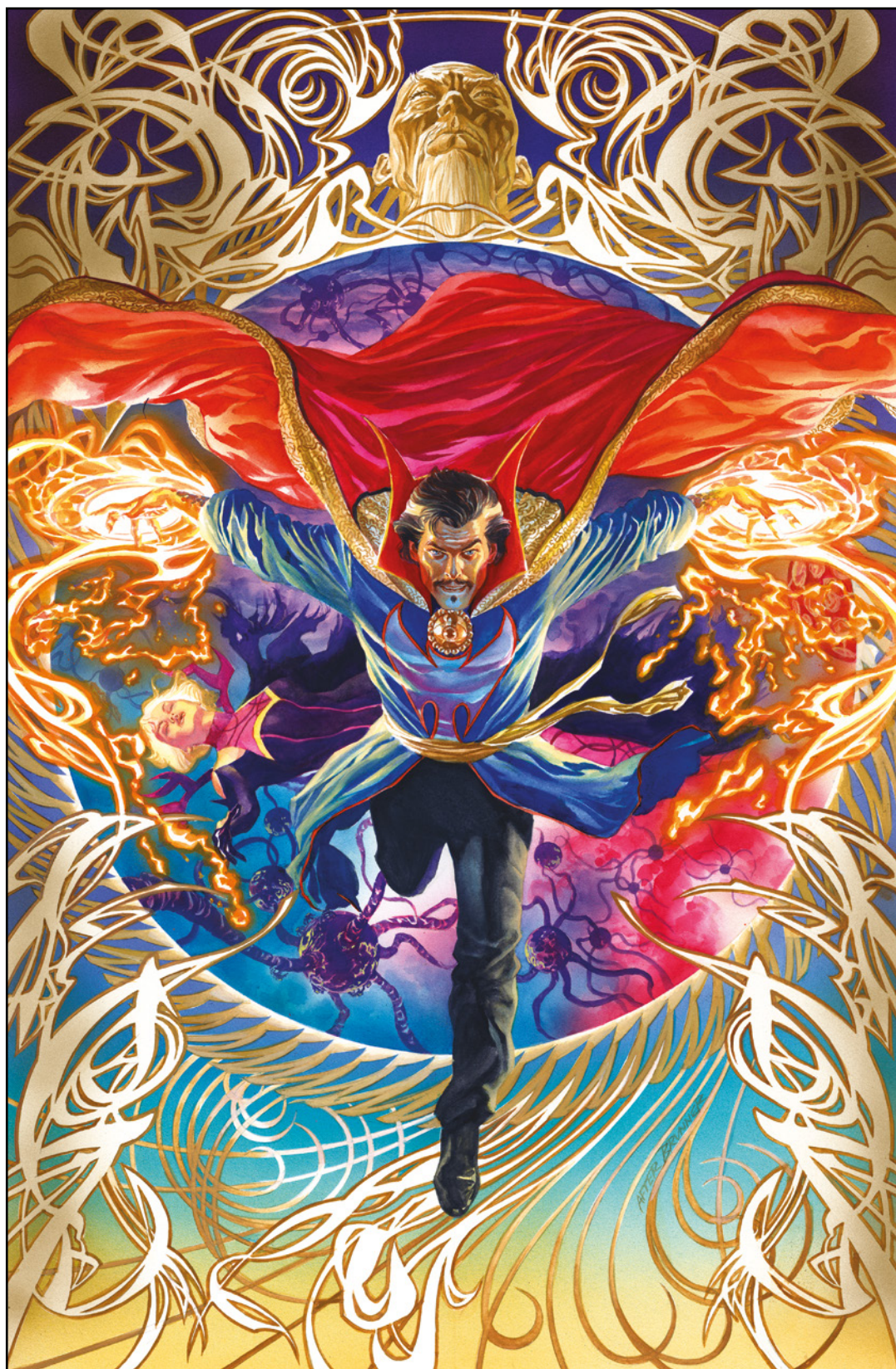
Doctor Strange (2023) 1 Cover von ALEX ROSS