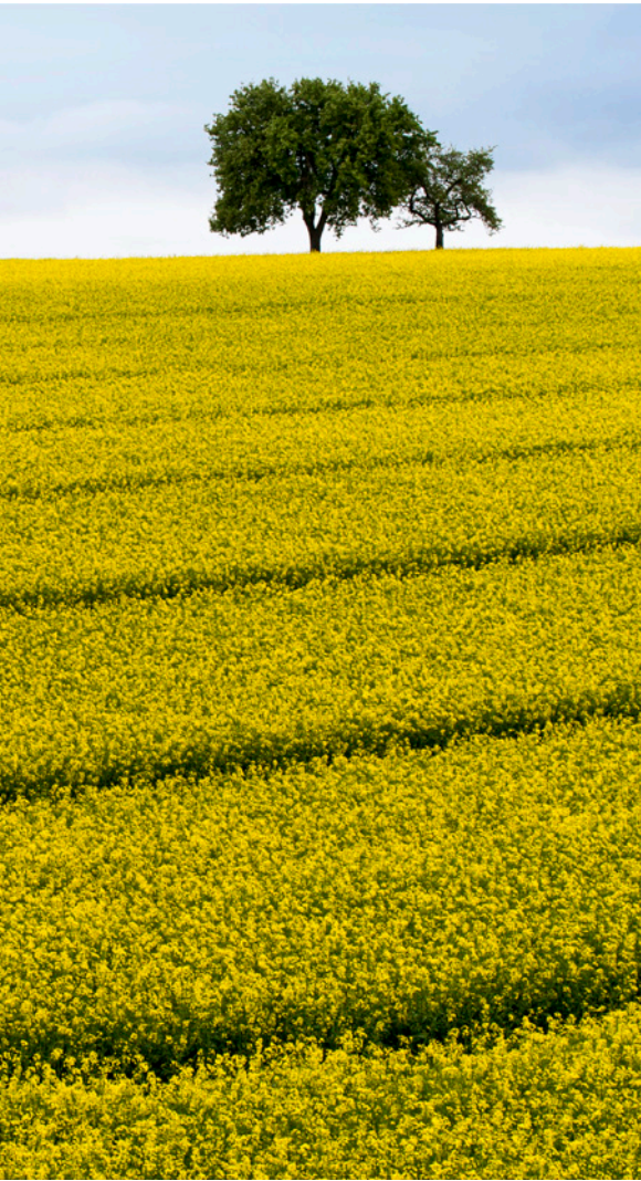
Gelbe Monotonie statt Artenvielfalt

Volksentscheide, welche auf die Politik einen gewissen Druck ausüben, oder durch ein verändertes Konsumverhalten. Produkte aus biologisch und nachhaltig geführter Landwirtschaft erfreuen sich zunehmender Beliebtheit. Vor allem wollen Menschen aktiv etwas tun, durch die Umgestaltung von Gärten und Pflanzungen in arten- und strukturreiche, naturnahe Anlagen. Sie möchten der Natur bei sich vor der Haustür, auf dem Balkon oder der Terrasse etwas zurückgeben,