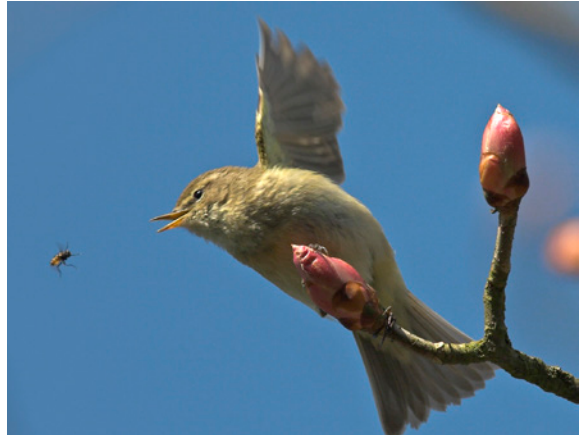
Zilpzalp beim lebenswichtigen Insektenfang

Volksentscheide, welche auf die Politik einen gewissen Druck ausüben, oder durch ein verändertes Konsumverhalten. Produkte aus biologisch und nachhaltig geführter Landwirtschaft erfreuen sich zunehmender Beliebtheit. Vor allem wollen Menschen aktiv etwas tun, durch die Umgestaltung von Gärten und Pflanzungen in arten- und strukturreiche, naturnahe Anlagen. Sie möchten der Natur bei sich vor der Haustür, auf dem Balkon oder der Terrasse etwas zurückgeben,