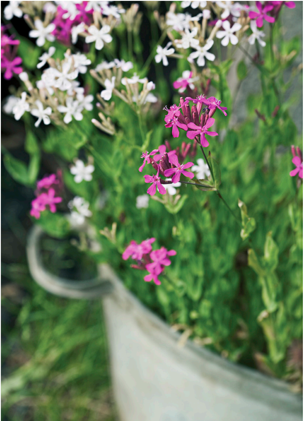
Das aus Südeuropa stammende Nelken-Leimkraut ist ein einjähriger Dauerblüher und zugleich Schmetterlingsmagnet.