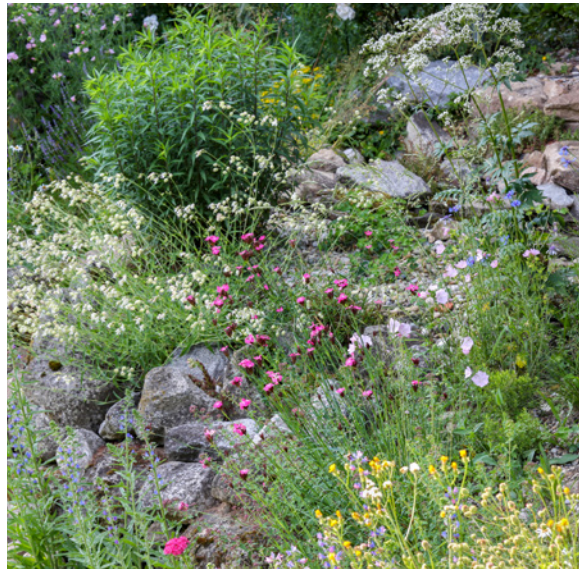
Naturnahe Gärten werden zur Ersatznatur.

was „draußen“ immer weniger zu finden ist: Artenvielfalt. Und wir wissen inzwischen, dass bei richtiger Anlage und Pflanzenverwendung Gärten genau dieses fehlende „Netz“ ersetzen können. Stadtbrachen, Gärten, aber auch das noch so kleine „Grün“ wie das im Kübel können zwischen hochwertigen Naturräumen eine sogenannte Trittbrettfunktion übernehmen, welche früher etwa Feldgehölze oder ungenutzte Restflächen innehatten.