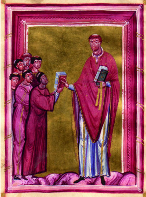
Abb. 1 Biblioteca Ambrosiana Mailand, C. 53 Sup., fol. 2r: Widmungsbild.

Dabei zeigt ein Blick auf die Überlieferung ottonischer Stifterbilder wie ungewöhnlich die Mailänder Darstellung ist. Prinzipiell kann zwischen Devotionsbildern, bei denen die darbringende Person in einer verehrenden Zuordnung zu der empfangenden Person gezeigt wird, und Dedikationsbildern, in denen eine Übergabehandlung stattfindet, typologisch unterschieden werden. 3 Devotionsbilder setzen eine heilige Person als Empfänger voraus. Zentrales Bildthema ist der kommunikative Akt zwischen den handelnden Personen, der sich bei Devotionsbildern in