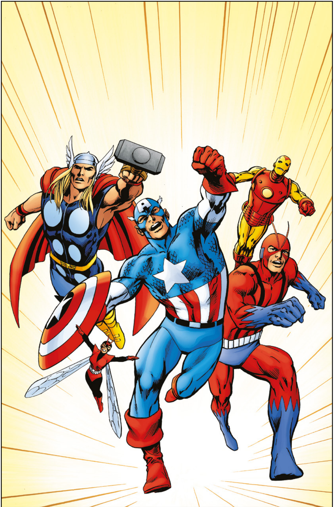
Avengers: War Across Time (2023) 1 Cover von ALAN DAVIS