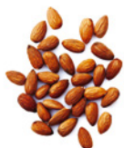
130 g Mandeln