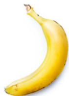
300 g sehr reife Banane, geschält, in Scheiben geschnitten