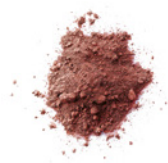
25 g Kakaopulver (ungezuckert)