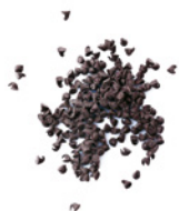
40 g dunkle Schokotropfen