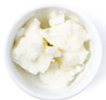
80 g Kokosöl