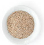
4 EL Flohsamenschalen