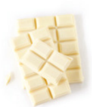
100 g weiße Schokolade