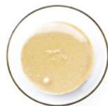
4 TL Tahin