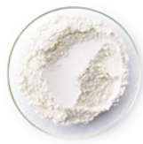
210 g Mehl