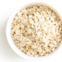
180 g Haferflocken