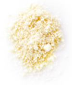
30 g gemahlene Mandeln