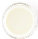
480 g Mandeldrink oder Schoko-Mandel- Drink (S. 27)