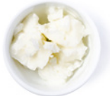
2 EL Kokosöl