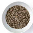
4 TL Chiasamen