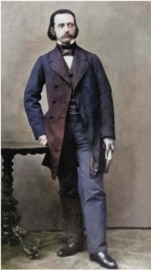
Theodor Fontane, um 1874