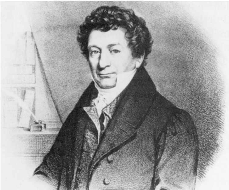
Abb. 1 Friedrich Sertürner (1783–1841)1

Wann begann alles? Natürlich vor sehr langer Zeit bei den alten Ägyptern und später bei den Griechen. Aber lassen wir diese mal beiseite und begeben uns mit einer Zeitmaschine in eine Stadt, die heute wohl kaum jemand mit pharmazeutischer Forschung und schon gar nicht mit Morphinum in Verbindung bringen würde – Paderborn. Im Jahr 1804 war Paderborn eine beschauliche Stadt in Westfalen, Teil des Königreichs Preußen und bekannt für seine theologische Universität, die bereits im Jahr 777 gegründet wurde. Es waren unruhige Zeiten zu Beginn des 19. Jahrhunderts, als Napoleon in Europa Krieg führte und die Stadt zwei Jahre später kampflos einnehmen sollte. Genau in dieser Zeit arbeitete Friedrich Sertürner (Abb. 1) als Apothekergehilfe in der Adler-Apotheke, nachdem er 1799 seine Lehre begonnen und 1803 sein Examen abgelegt hatte. Er wurde 1783 als Sohn des österreichischen Landvermessers Josephus Simon Sertürner in der Nähe von Paderborn geboren. Was seinen Vater bewog, in die Dienste des Fürsten Friedrich Wilhelm von Paderborn und Hildesheim zu treten und nach Paderborn zu ziehen, ist nicht bekannt. Die Familie Sertürner führte ein angenehmes Leben, von Wissenschaft und Pharmazie war nicht viel zu spüren. War der Filius gelangweilt oder was entzündete sonst sein wissenschaftliches Feuer?