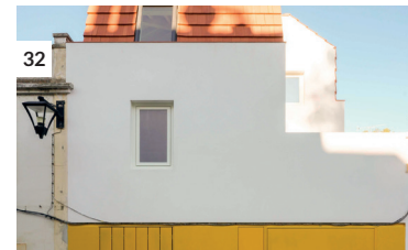
32 Casa + Atelier