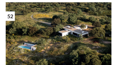
52 Casa no Crato