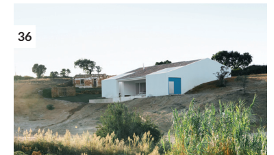
36 Casa Cercal