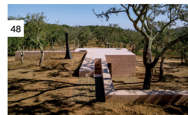
48 Casa Promise