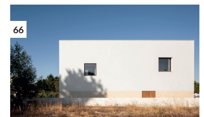
66 Casa nos Brejos da Carregueira