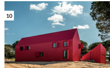
10 Casa 3000