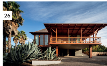
26 Barrocas Main House Expansion