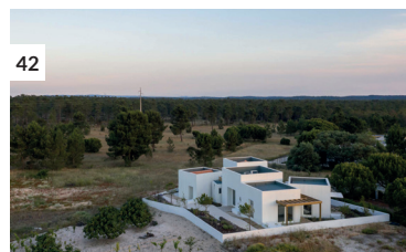
42 Casa da Comporta