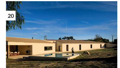
20 Casa na Aldeia do Freixo