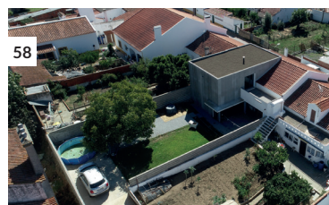
58 Casa B + P = J