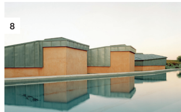
8 Herdade da Cardeira

Impreso en Argentina / Printed in Argentina Mayo 2023 / May 2023