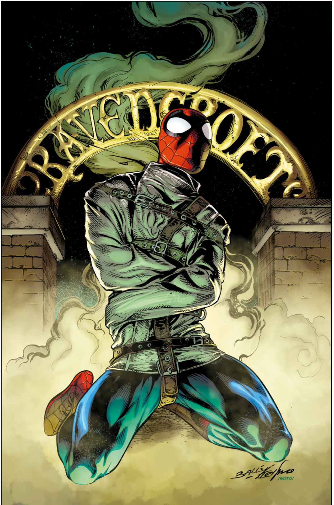
Amazing Spider-Man (2018) 48 Cover von MARK BAGLEY