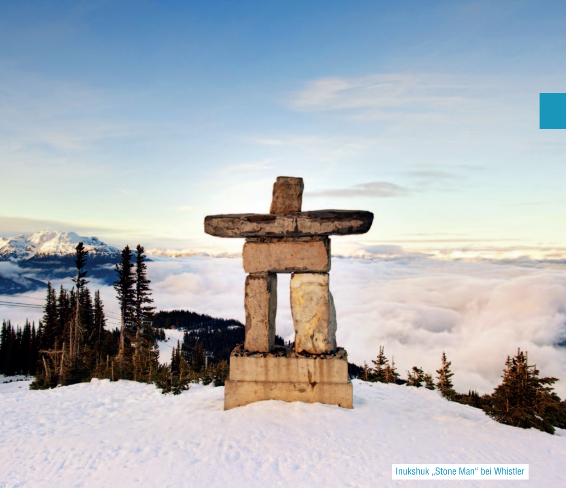
Inukshuk „Stone Man“ bei Whistler

Mount Currie , wo wir wieder einen Ausflug zum im Hinterland liegenden Birkenhead Lake Provincial Park anbieten.