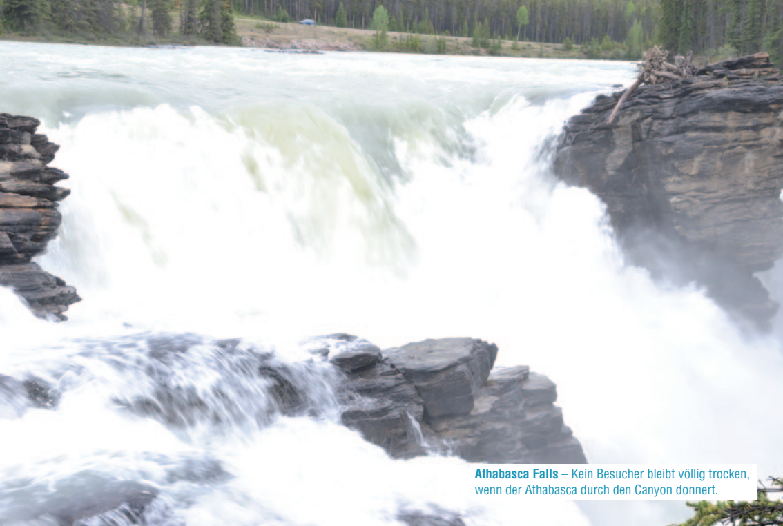
Athabasca Falls – Kein Besucher bleibt völlig trocken, wenn der Athabasca durch den Canyon donnert.