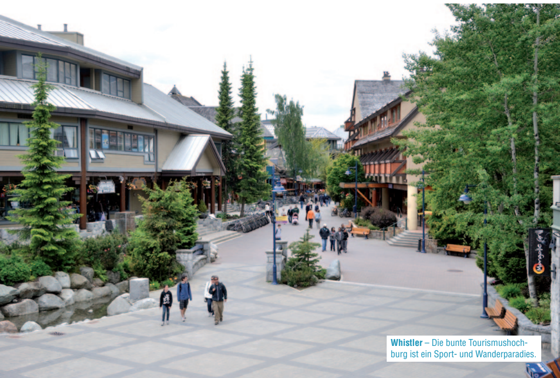
Whistler – Die bunte Tourismushochburg ist ein Sport- und Wanderparadies.