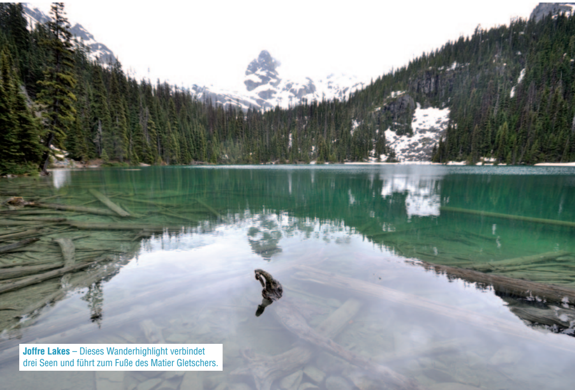
Joffre Lakes – Dieses Wanderhighlight verbindet drei Seen und führt zum Fuße des Matier Gletschers.