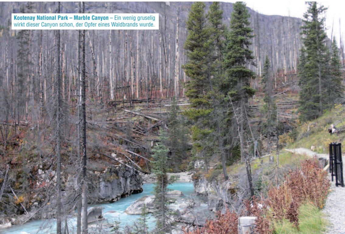
Kootenay National Park – Marble Canyon – Ein wenig gruselig wirkt dieser Canyon schon, der Opfer eines Waldbrands wurde.