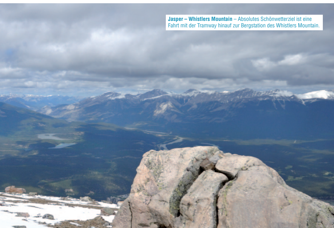
Jasper – Whistlers Mountain – Absolutes Schönwetterziel ist eine Fahrt mit der Tramway hinauf zur Bergstation des Whistlers Mountain.