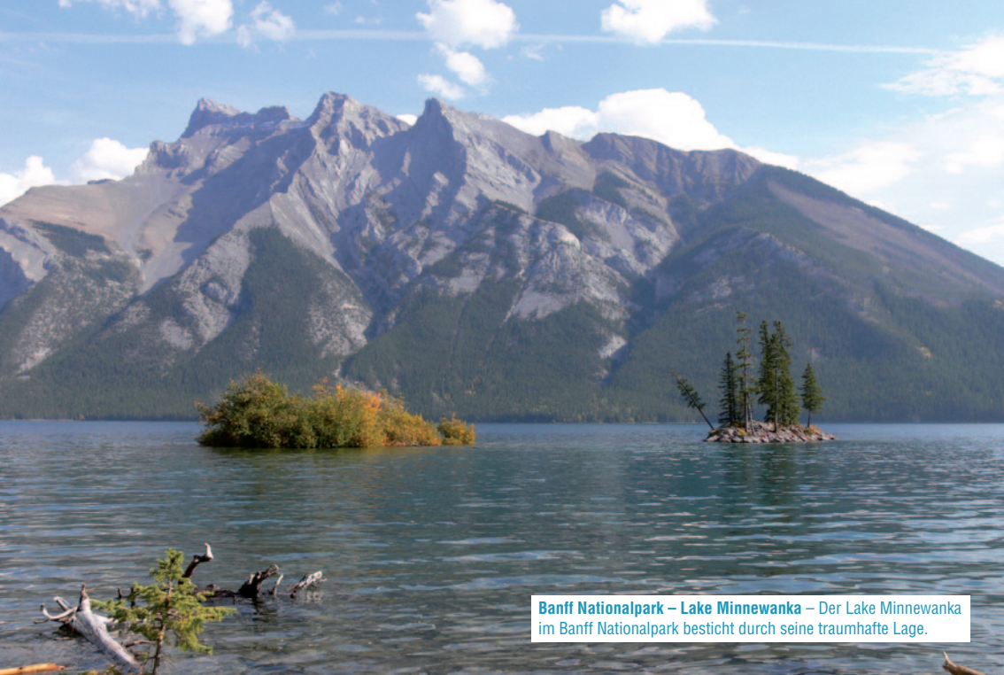
Banff Nationalpark – Lake Minnewanka – Der Lake Minnewanka im Banff Nationalpark besticht durch seine traumhafte Lage.