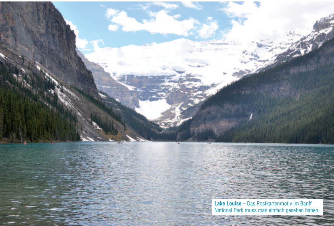
Lake Louise – Das Postkartenmotiv im Banff National Park muss man einfach gesehen haben.