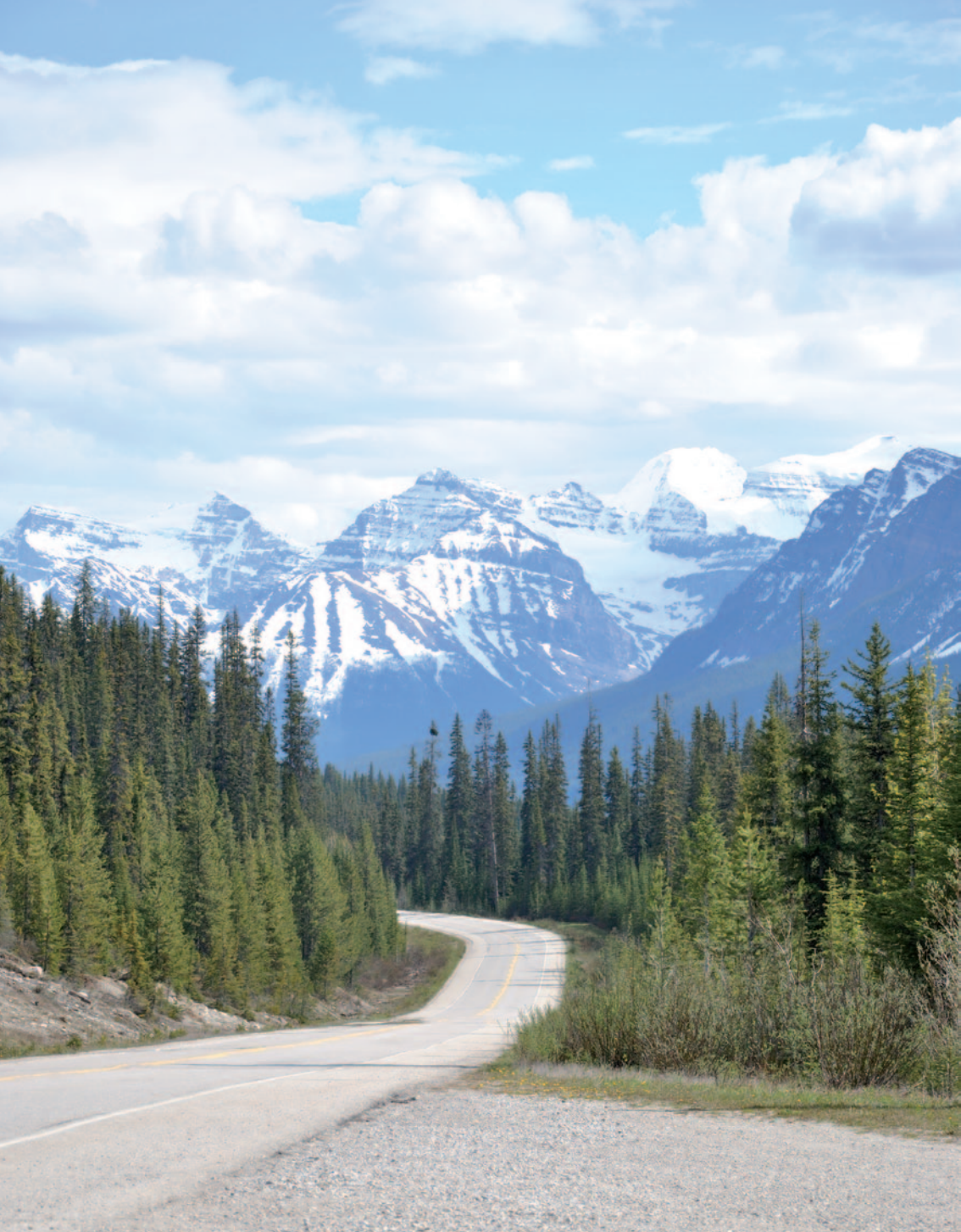
Icefields Parkway – Die Traumstraße durch den Banff und Jasper National Park ist der Höhepunkt der Reise durch den kanadischen Westen.