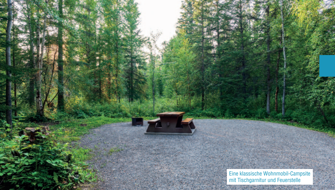
Eine klassische Wohnmobil-Campsite mit Tischgarnitur und Feuerstelle

te Reisezeit ist von Ende Mai bis Anfang Oktober, allerdings ist im Frühling in den Bergen noch mit verschneiten Wegen oder teilweise vereisten Seen zu rechnen, die Nächte können im Frühling und Herbst leicht frostig sein. Bedenken Sie dies bei der Übernahme des Wohnmobils, ein zusätzlicher Schlafsack kann da sehr hilfreich sein.