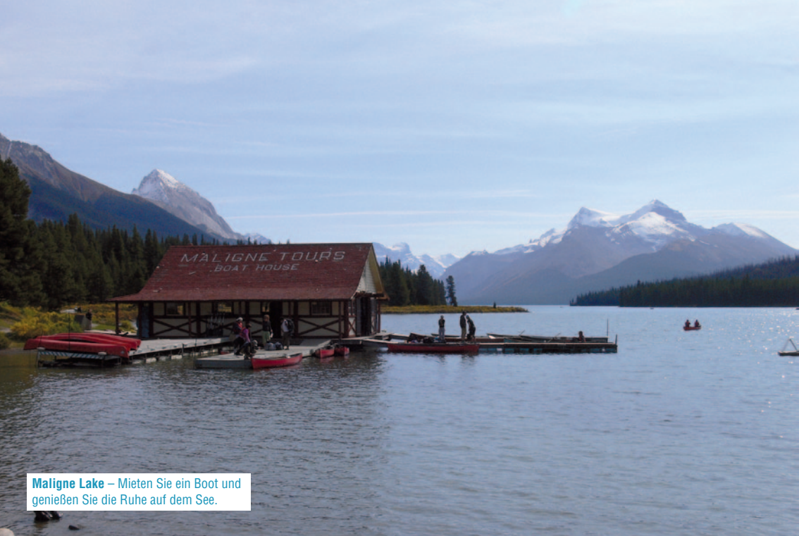
Maligne Lake – Mieten Sie ein Boot und genießen Sie die Ruhe auf dem See.