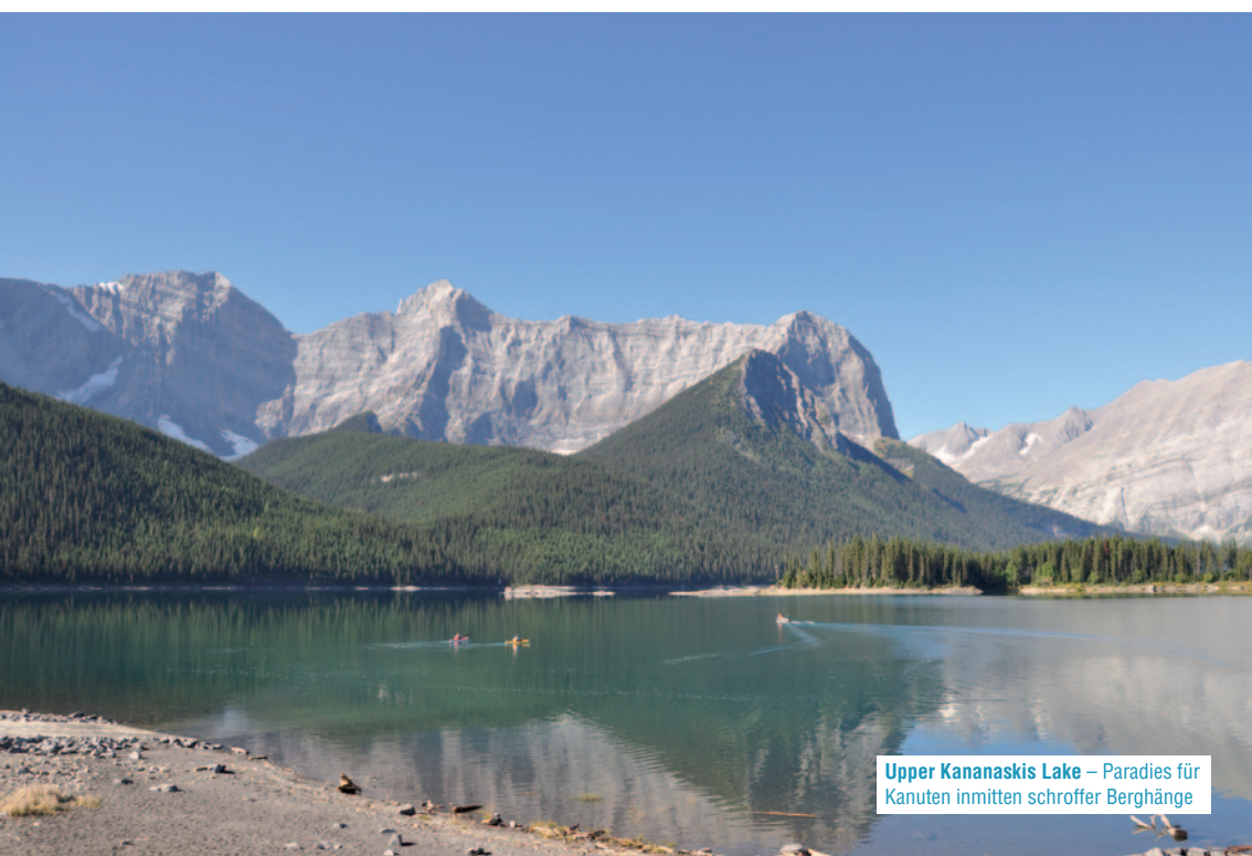
Upper Kananaskis Lake – Paradies für Kanuten inmitten schroffer Berghänge