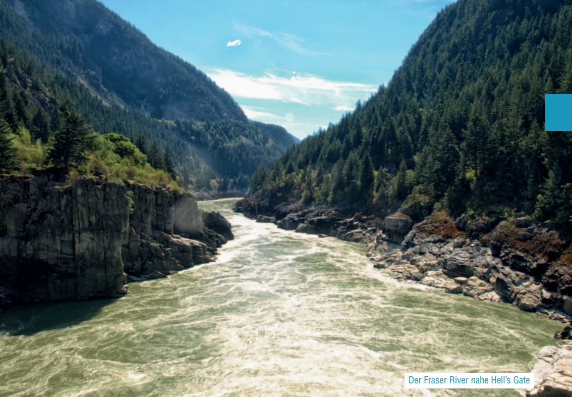
Der Fraser River nahe Hell's Gate

der faszinierend ist der kleine „Nachbar“ Moraine Lake , der malerisch im Tal der zehn Berggipfel liegt.