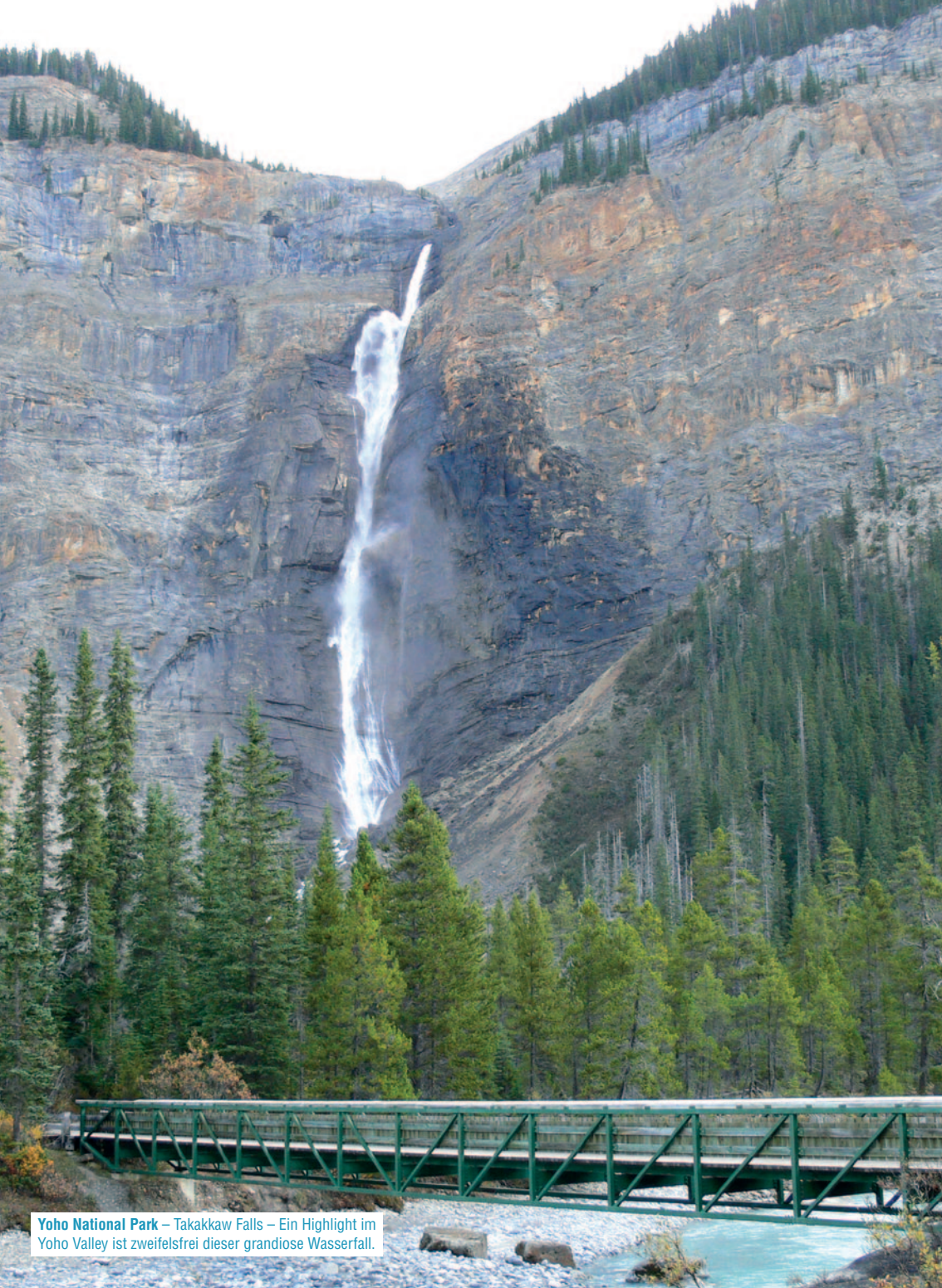
Yoho National Park – Takakkaw Falls – Ein Highlight im Yoho Valley ist zweifelsfrei dieser grandiose Wasserfall.