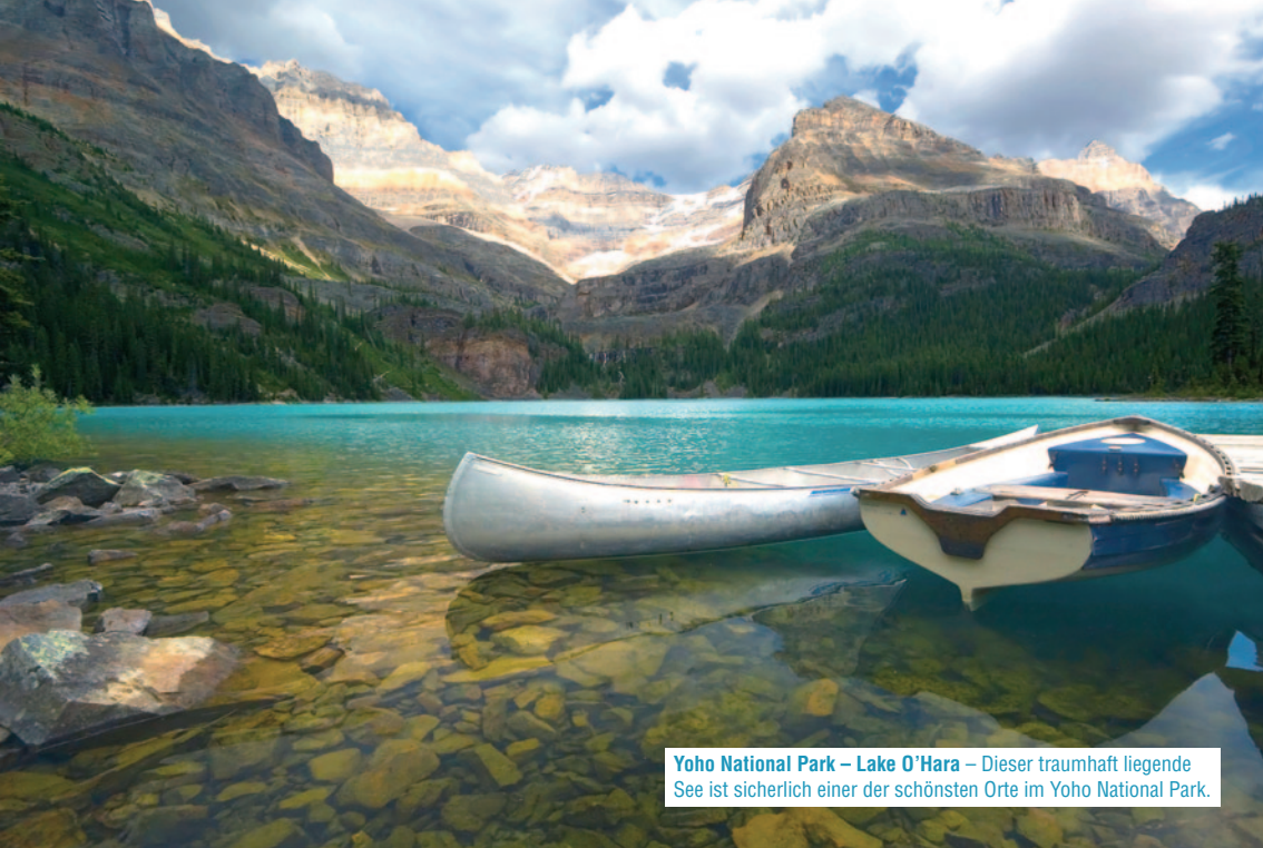
Yoho National Park – Lake O'Hara – Dieser traumhaft liegende See ist sicherlich einer der schönsten Orte im Yoho National Park.