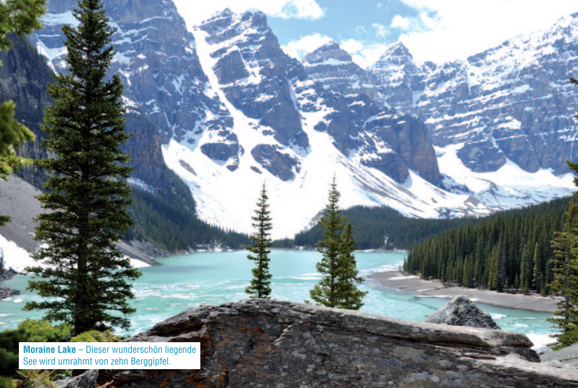
Moraine Lake – Dieser wunderschön liegende See wird umrahmt von zehn Berggipfel.