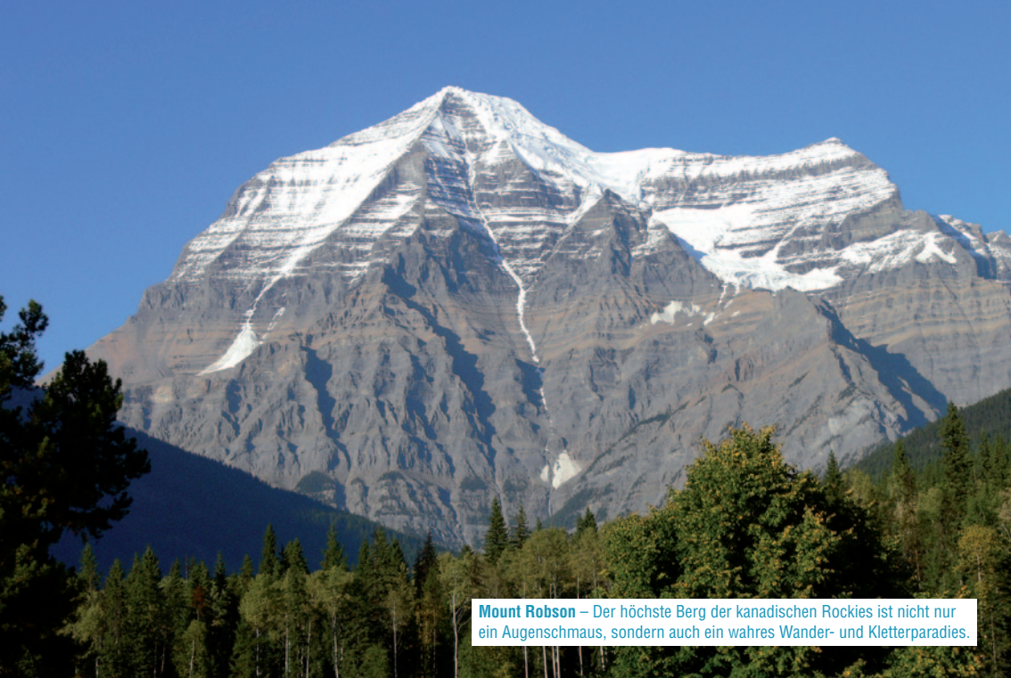
Mount Robson – Der höchste Berg der kanadischen Rockies ist nicht nur ein Augenschmaus, sondern auch ein wahres Wander- und Kletterparadies.