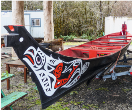
Indianer der Nordwestküste fertigen Kanus traditionell aus einem Baumstamm

Die Küsten-Indianer besiedelten den Küstenstreifen zwischen der Cascade Range bzw. der Sierra Nevada und der Pazifikküste. Diese Stämme erlangten bis zur Ankunft der Weißen einen gewissen Wohlstand : Die Flüsse und der Pazifik boten reichlich Fisch, das mild-feuchte Klima sorgte für holzreiche Wälder mit dichtem Wildbestand, und auch die Bedingungen für Ackerbau und das Sammeln von Früchten waren gut. Zum Norden hin, im Küstenstreifen der heutigen Staaten Oregon, Washington und British Columbia war damals zwar aus klimatischen Gründen Ackerbau nur in begrenztem Umfang möglich, doch lebten auch diese Stämme in Wohlstand. Das zeigte sich an ihrer Bau-