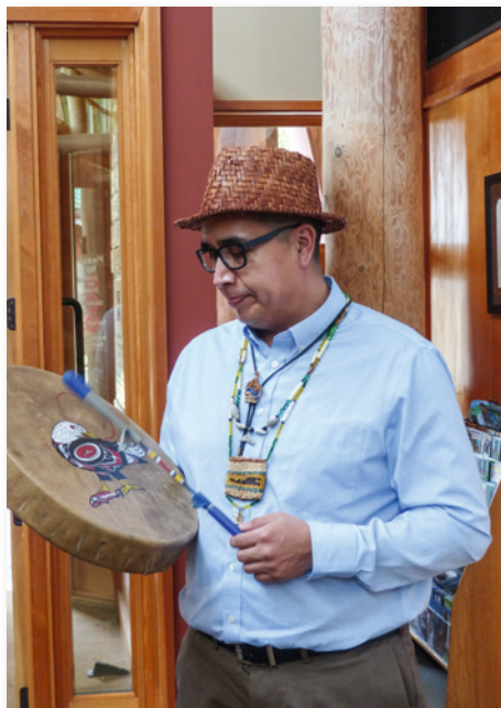
Indianer bilden die Urbevölkerung im Nordwesten

Nirgendwo in den USA leben mehr Ureinwohner als im Westen, und auch außerhalb der Reservate findet man in vielen Städten einen relativ hohen indianischen Bevölkerungsanteil. Doch entspricht das Bild weniger den edlen Klischeevorstellungen aus Filmen und Büchern – die Realität ist eine andere und zeigt auch schlechte Lebensbedingungen, Armut, Alkohol- und Drogenprobleme sowie Arbeitslosigkeit.