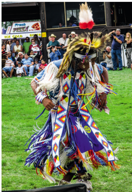
Powwows sind Ausdruck des Selbstbewusstseins der Indianer