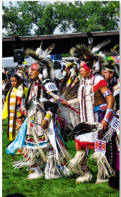
„Warriors of the Plains“

Die Tatsache, dass in Hollywood-Produktionen oder in der Abenteuerliteratur eines Karl May immer wieder Stammesnamen wie Arapaho , Blackfoot , Cheyenne , Comanche , Crow , Kiowa , Mandan oder Lakota (Sioux) auftauchen, mag daran liegen, dass deren Alltag besonders gut das Klischee vom freien, kämpferischen und – je nach Perspektive – grausamen oder „edlen Wilden“ widerspiegelte. Immerhin waren es die Lakota gewesen, die sich unter Führern wie Crazy Horse oder Sitting Bull neben den Comanches und Apaches am heftigsten gegen die weiße Landnahme gewehrt hatten.