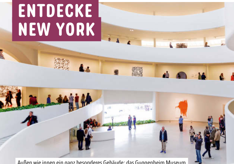
Außen wie innen ein ganz besonderes Gebäude: das Guggenheim Museum

New York, das ist die Hauptstadt des amerikanischen Traums. Wer diese riesige, energische, nervenkitzelnde Stadt und ihren Einfluss auf den Rest der Welt begreifen will, muss selbst hinfahren und dort aufwachen – mitten im nie endenden Summen der Metropole, zwischen Sirenengeheul und Zuggeratter, als einer von rund achteinhalb Millionen Menschen aus allen Ländern der Welt. Das New-York-Gefühl muss man einfach selbst erleben. Hautnah.