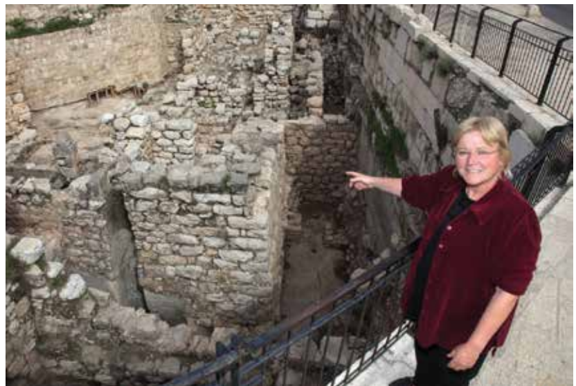
Eilat Mazar en Jerusalén

Queda claro, por tanto, que Mazar fue una investigadora prolífica, pero también muy polémica. A ella misma le gustaba definirse como una arqueóloga conservadora y maximalista, es decir, que estaba convencida de que la arqueología debía servir para corroborar la veracidad del texto bíblico, siguiendo la estela de ilustres predecesores como su propio abuelo. Aquel posicionamiento es el que le llevó a protagonizar acaloradas discusiones científicas con muchos de sus colegas que trabajaban desde ideologías opuestas. Nada de ello, sin embargo, debe empañar la importancia de su trabajo.