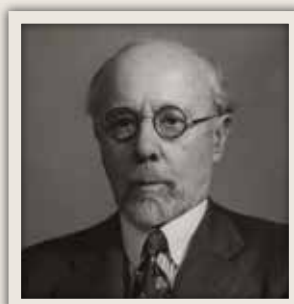
John Garstang en 1950

la Escuela Británica de Arqueología de Jerusalén, así como director del Departamento de Antigüedades de Palestina durante el Mandato británico. Fue entonces cuando se adentró de lleno en la arqueología bíblica a través de sus excavaciones en Hazor. No obstante, su trabajo principal fueron los trabajos en Jericó, llevados a cabo entre 1930 y 1936. A lo largo de las excavaciones pudo documentar por primera vez los famosos niveles de ocupación neolíticos del asentamiento. Sin embargo, sus principales esfuerzos se centraron en tratar de confirmar la veracidad histórica del relato de Josué acerca de la conquista israelita de la ciudad, puesta en duda por W. F. Albright y C. Watzinger. En este sentido, Garstang defendía que la denominada muralla doble de adobe debía datarse en la época del Bronce Final, por lo que debió de ser la muralla derribada por los israelitas, tal y como se describe en la Biblia. Sin embargo, como es bien sabido, las excavaciones posteriores de Kathleen Kenyon demostraron que dicha muralla en realidad era del Bronce Antiguo III, y que la Jericó de la época de Josué no disponía de fortificaciones de ningún tipo, lo que supuso un duro