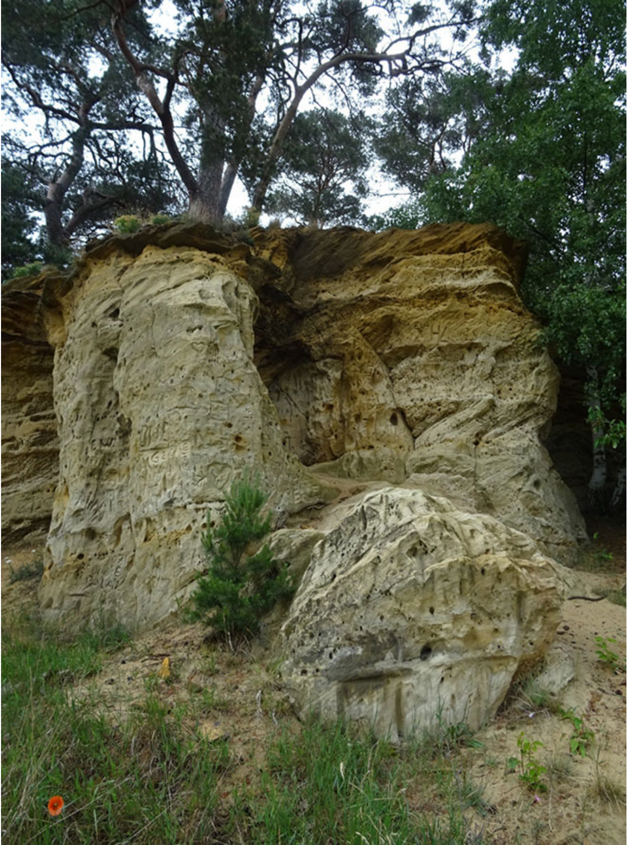
Sandsteinfelsen bei Hedeper