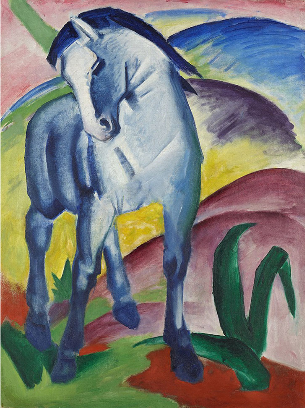
Das blaue Pferd, 1911 (Gemälde nach Wikipedia gemeinfrei)