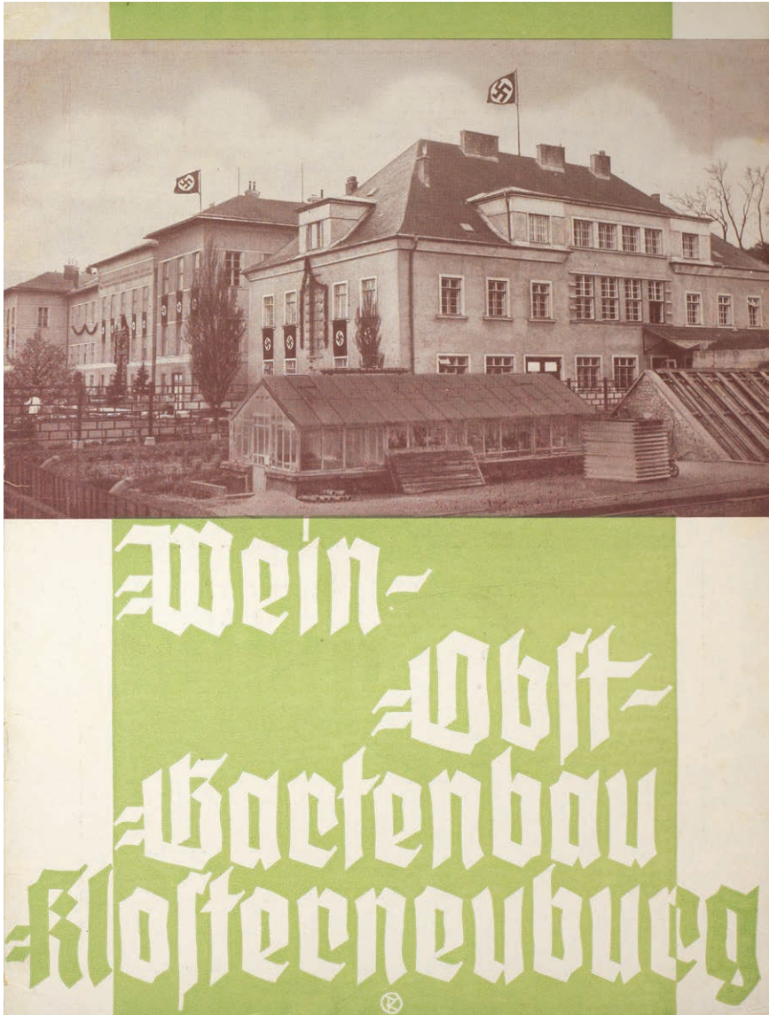
1 »Träger deutscher Kultur und Wissenschaft«: Titelblatt einer Werbeschrift des Verbands der Klosterneuburger Önologen, Pomologen und Gartenbauarchitekten aus dem Jahr 1939.