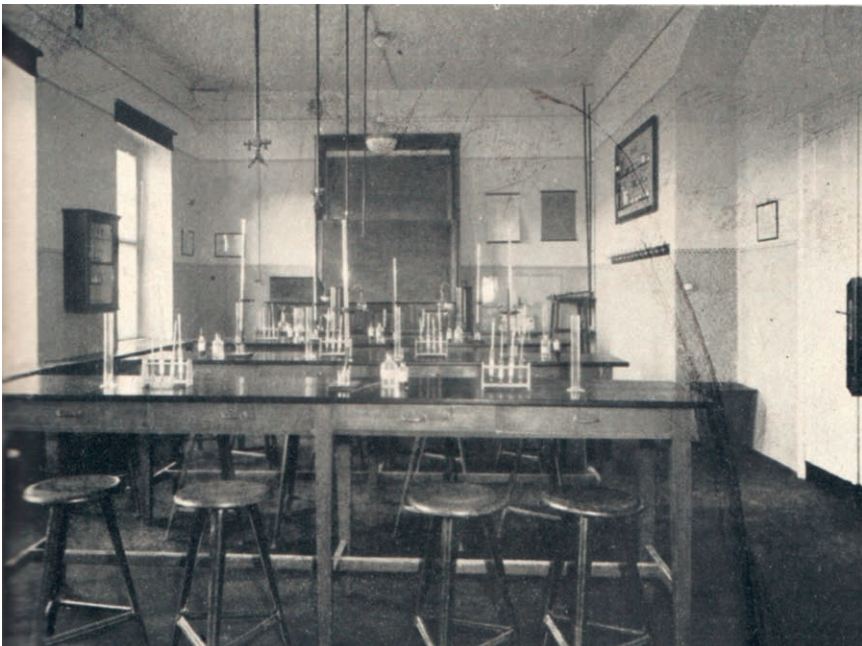
4 Zweigelt's Wirkungsstätte: Das botanische Versuchslaboratorium in der HBLA Klosterneuburg, vor 1930.