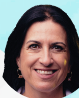
Mar Coloma Rijeka, la nueva versión de EXOCAD