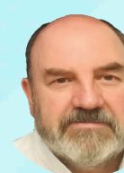
Carlos Elorza Maquillaje para Zirconio y Disilicato