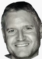
Miquel Ferrer Diseño digital de prótesis completas