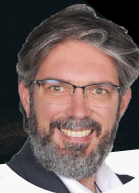
José Ramón Escabías Impresión 3D de Kulzer