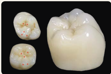
La morfología primaria (PM/PS)