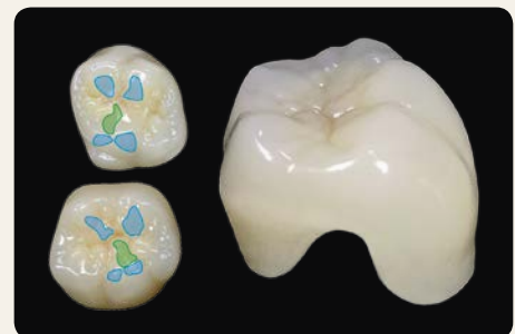
La morfología secundaria abrasiva (SLA/SMA/SSA)

gebdi Dental-Products GmbH · Germany www.gebdi-dental.com · e-mail: info@gebdi-dental.com · Tel. (+41) 775250601