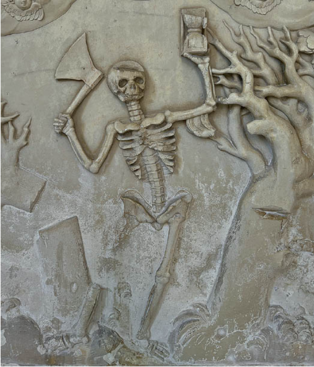
Relief aus der Totentanz-Kapelle in Straubing ( Kapitel 17 ).