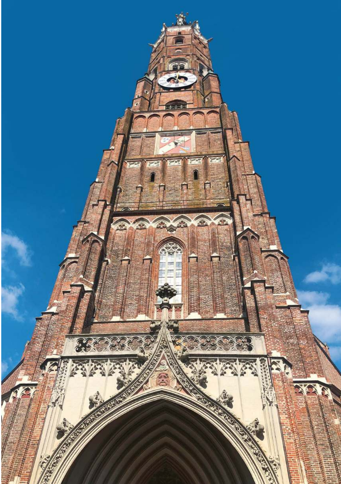
Der Backsteinkirchturm der Martinskirche in Landshut - ein Bau, der Menschenleben forderte ( Kapitel 1 ).