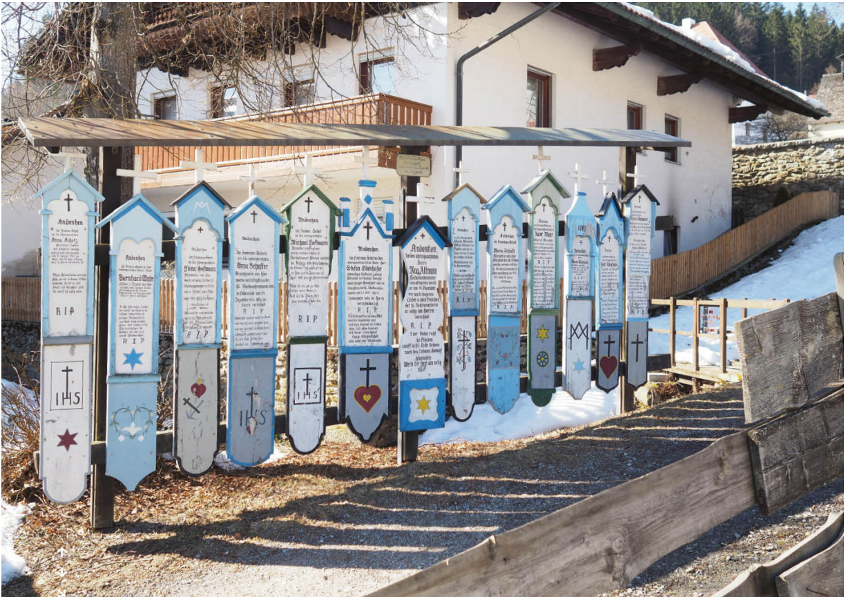
Totenbretter, auf denen Leichen aufbewahrt wurden ... (Kapitel 12).