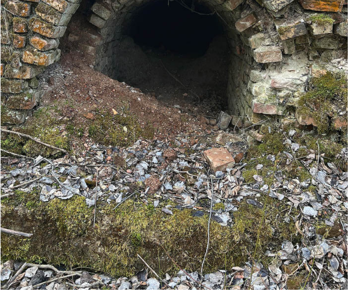
Düstere Tunnel ... (Kapitel 14).