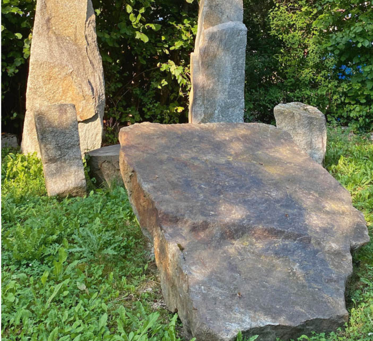
Oder mystische Steinkreise - hier kommen Niederbayerns 33 absolut sehenswerte Lost & Dark Places ( Kapitel 16 ).