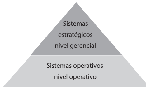
Figura 2. Clasificación de los sistemas de información.

Dentro de los diferentes sistemas que puede tener una empresa, se encuentra el sistema de información contable, clasificado entre en los sistemas de información operativos, pero que sirven de apoyo a los niveles gerenciales.