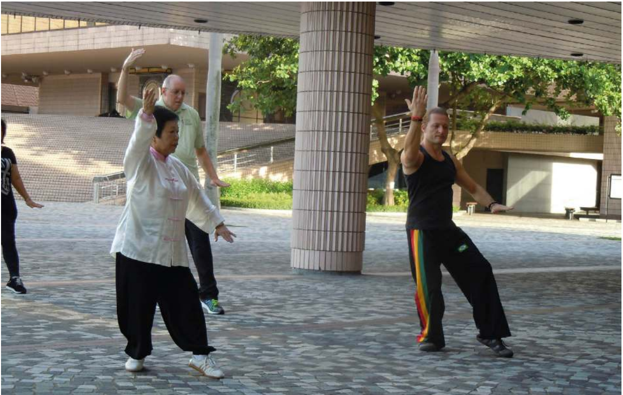
Abb. 2.4: Regelmäßiges Tai-Chi-Training verbessert die körperliche Leistungsfähigkeit und ist gut für die Gesundheit.

darstellt, bleibt genügend übrig, um den Kopf zu beschäftigen.