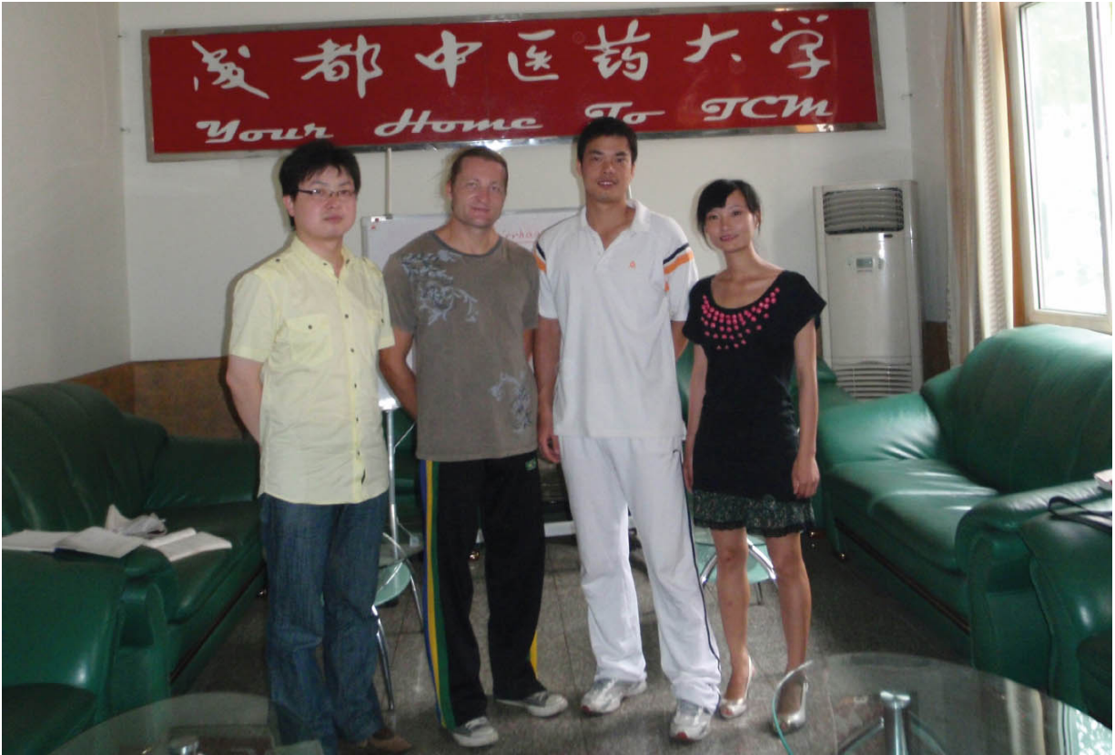
Abb. 2.2: Team der TCM-Abteilung für internationale Beziehungen der Universität Chengdu, 2009

schon hier, dass dieser Zugang nicht nur für die Kampfkunst, sondern auch für eine allgemeine Gesundheitsförderung ausschlaggebend ist.