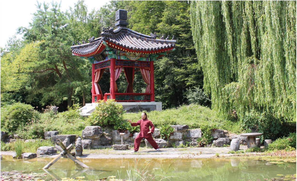
Abb. 2.1: Tai Chi: Yang-Stil-Form

Der theoretische Unterbau des Tai Chi und der chinesischen Kampfkünste ist bedingt durch die jahrtausendealte Kultur des Landes. Die Verbindungen zu philosophischen und kulturellen Konzepten finden sich hier genauso wie Bezüge zur traditionellen Medizin. Für den westlichen Menschen sind diese Ansätze oft seltsam und schwer verständlich.