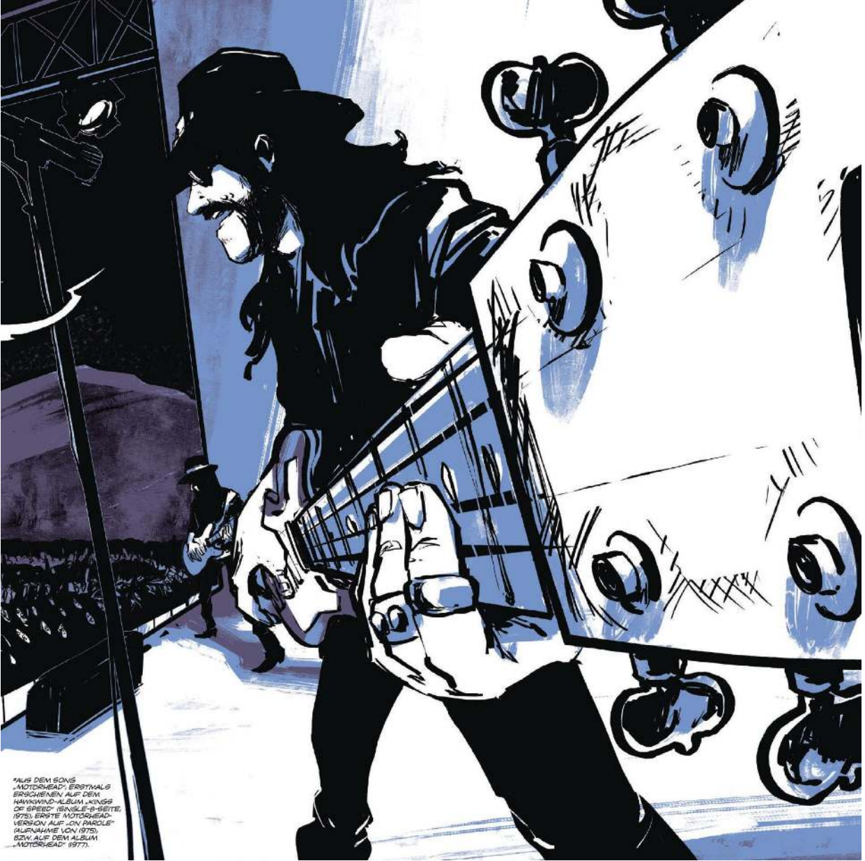
*AUS DEM SOUS „MOTORHEAD“ ERSTMALIG ERSCHEINEN AUF DEM HAWKING-ALBUM „KINGS OF SPEED“ (SINGLE-B-SEITE, 1975), ERSTE MOTORHEAD- VERSION AUF „ON PAROLE“ (AUFNAHME VON 1975), ODER AUF DEM ALBUM „MOTORHEAD“ (1977).