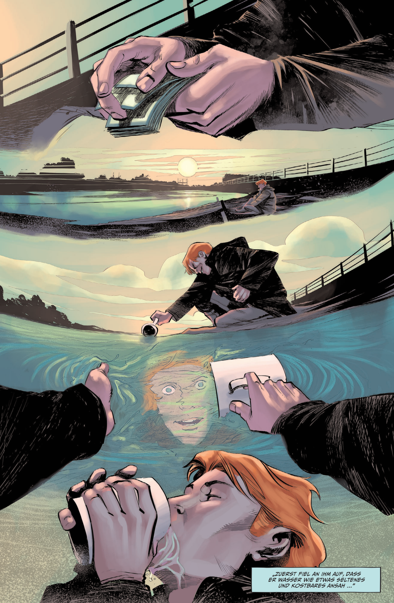
„ZUERST FIEL AN IHM AUF, DASS ER WASSER WIE ETWAS SELTENES UND KOSTBARES ANSAH ...“