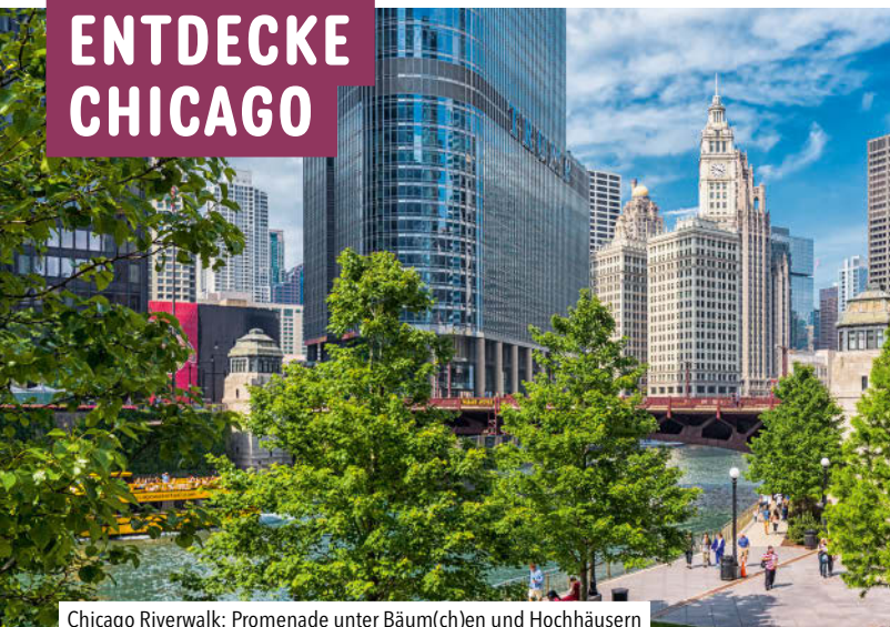
Chicago Riverwalk: Promenade unter Bäum(ch)en und Hochhäusern

Düster, unheimlich und erdrückend erscheint die Stadt auf historischen Bildern. Sicher, es hat die legendären Schlachthöfe gegeben, aber heute stehen dort nur noch Ruinen. Die berühmten Gangster wie John Dillinger und Al Capone sind längst tot, und die Kriminalitätsrate liegt unter der vieler anderer Städte. Was für eine Überraschung, wenn man zum ersten Mal in diese Metropole kommt und alle Vorurteile von der Wirklichkeit verdrängt sieht.