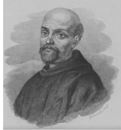
Abb. aus Iconoteca Italiana ossia Collezione di sessanta ritratti d'illustri Italiani . Firenze 1851.

Während sechs Jahren war Evangelista nun Schüler von Castelli, wobei Raffaello Magiotti 7 aus Montevarchi und Antonio Nardi 8 aus Arezzo zu seinen Mitschülern gehörten – Galilei sprach jeweils anerkennend von dem „Triumvirat“, wenn von diesen drei Schülern Castellis die Rede war.