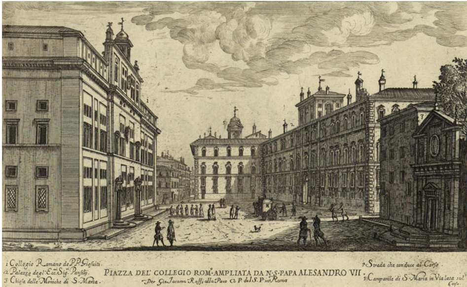
Abb. 1.3 Links das in den Jahren 1582–84 von Bartolomeo Ammanati errichtete Gebäude des Collegium Romanum; rechts der Palazzo Doria-Pamphilj. – Abb. aus Giovanni Battista Falda, Il nuovo teatro delle fabriche et edificii in prospettiva di Roma moderna . Volume primo. Rom 1665.

überstürzte Entscheidung gegenüber dem Autor dieses Werkes getroffen habe. 10 Torricelli ergreift dann die Gelegenheit, um sich bei Galilei vorzustellen und sich bei ihm anzupreisen: