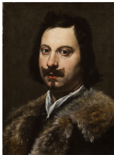
Abb. 1.9 Lorenzo Lippi: Porträt von Evangelista Torricelli. 1647. Öl auf Leinwand, 47,7 × 36 cm.