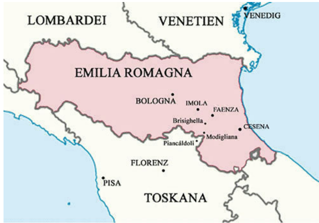
Abb. 1.1 Die verschiedenen Ortschaften, die als Torricellis Geburtsort diskutiert worden sind