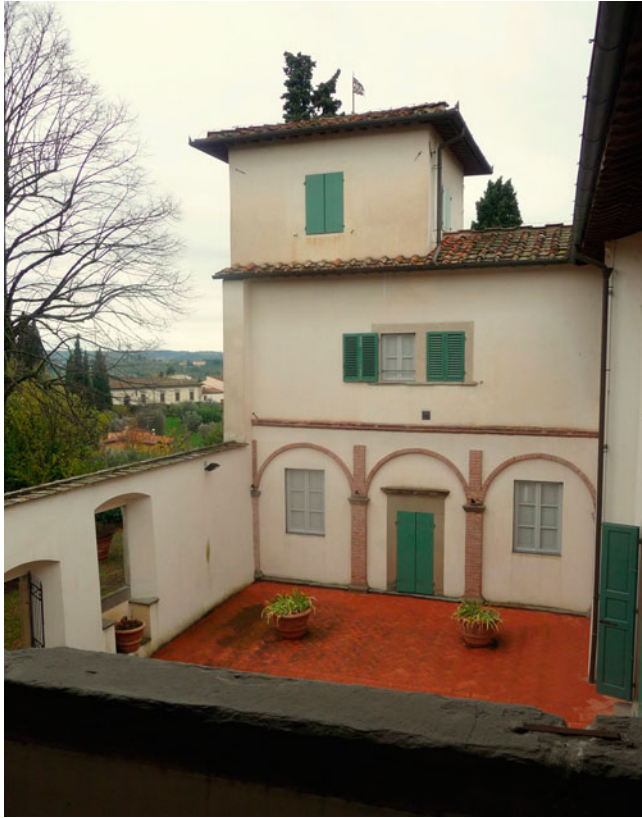
Abb. 1.7 Der Innenhof der Villa Galileis in Arcetri. Die beiden Fenster unter den Bögen beidseits der geschlossenen Türe gehören zu den Gemächern Torricellis (links) und Vivianis (rechts).

scienze attinenti alla meccanica hinzuzufügende „Quinta Giornata“ zu diktieren. 34 Ein zweites Vorhaben Galileis, nämlich einen Bericht über eine Reihe von älteren Experimenten im Zusammenhang mit der Stoßwirkung zu verfassen, konnte nicht mehr zu Ende gebracht werden 35 , denn kaum drei Monate nach Torricellis Ankunft in Arcetri, am 8. Januar des folgenden Jahres, starb Galilei: