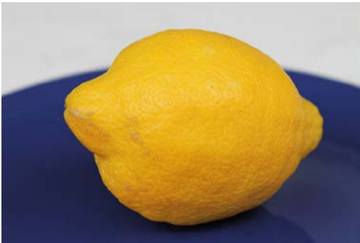
Abb. 2: Zitrone

Die Strukturierung des mentalen Lexikons stellen wir uns mittlerweile seit 40 Jahren wie ein Netzwerk vor (Collins/Loftus 1975; Dell/O’Seaghdha 1991; Foygel/Dell 2000; Martin et al. 1994; Rothweiler 2001; Schwartz et al. 2006). In dieses Netzwerk werden semantische Merkmale (Cues) als interagierende Knotenpunkte eingetragen und bei der Konzeptbildung miteinander verknüpft. Die Netzwerk-Theorie soll am Beispiel einer Zitrone (Abb. 2) konkretisiert werden.