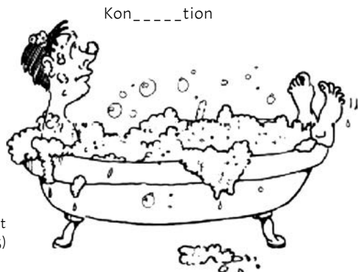
Abb. 3: Badewanneneffekt (Aitchison 1997, 175)

Badewanneneffekt: Bei der Einspeicherung längerer Wörter (drei und mehr Silben) lässt sich der sogenannte „Badewannen-Effekt“ nachweisen (Abb. 3). Wenn wir uns einen Menschen in einer Badewanne vorstellen und ihn von der Seite betrachten, sehen wir gegebenenfalls den Kopf auf der einen Seite und die Füße auf der anderen Seite herausragen. Den mittleren Teil des Körpers sehen wir nicht.