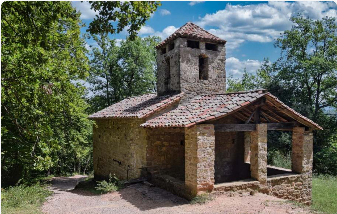
Sant Miquel del Corb, al final de la ruta

Continuamos por la pista amplia atravesando la masía l'Antiga para llegar a otra ermita románica, Sant Miquel del Corb, completando así el descubrimiento de dos de las capillas más bellas y recónditas de la Garrotxa. El camino con suaves desniveles nos lleva hasta la fuente del Racó y luego hasta una bifurcación bien señalizada donde podemos escoger si bajar a Les Preses, o enfilarse la subida final al punto de partida, el Área recreativa de Xenacs.