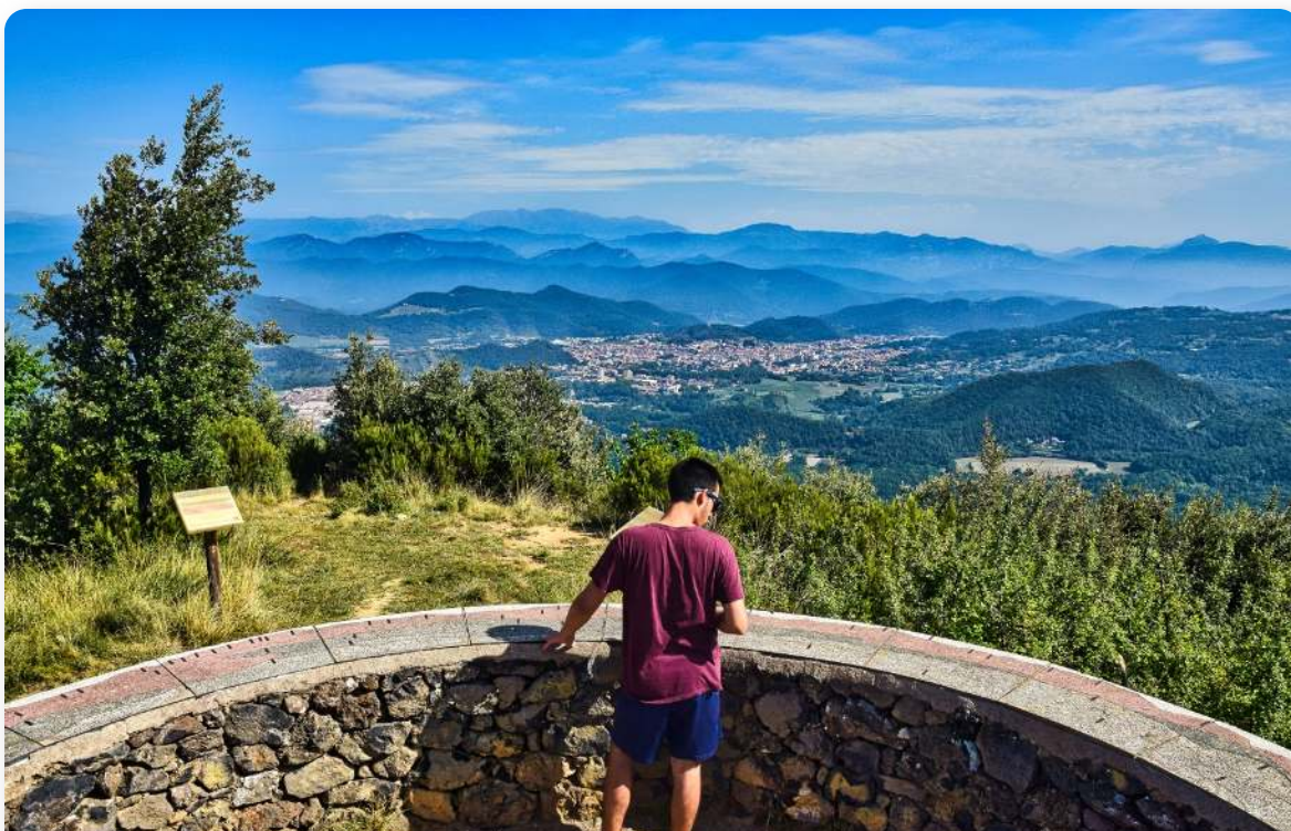
Vistas desde el mirador del Puig Rodó