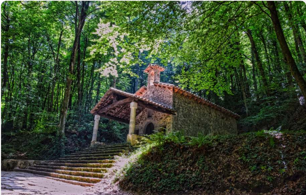
Ermita de Sant Martí del Corb

Volvemos al collado y comenzamos el descenso por el barranco. Tras los primeros metros encajados entre rocas hay que girar a la derecha buscando las marcas amarillas que nos indican la trayectoria menos inclinada. El camino, pronunciado al principio, se suaviza y continúa bajando ya con menos pendiente hasta encontrar la pista que, hacia la izquierda, conduce hasta un bello rincón silencioso y sombrío donde se levanta la ermita de Sant Martí del Corb. Los escasos rayos de sol que se cuelan entre en la espesura otorgan a esta pequeña joya un aire misterioso. Se trata de una ermita de origen románico y pertenece al municipio de las Preses. Escondida en medio de un frondoso hayedo, el edificio es de una sola nave con un ábside semicircular. Destaca el bonito soportal de la fachada y una bonita fuente situada a un lado de la ermita, lo que compone un rincón que invita a hacer un breve descanso para disfrutar de este magnífico paraje.