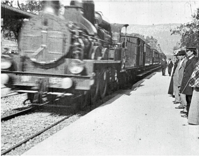
La película de los Lumière subrayó el impacto visceral del cine.