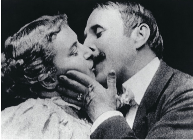
La controversia que rodeó a The Kiss (1896) sentó las bases de la relación del cine con el sexo.

El cine impactó al público desde sus inicios. Y no por lo que mostraba (aunque la controversia en torno al contenido se convertiría en un elemento constante en la historia del medio), sino por su propia existencia. El «impacto de lo nuevo» radicó en la proyección de imágenes en movimiento que captaban nuestro mundo, que se podían repetir una y otra vez y que, más adelante, podrían ser manipuladas de maneras todavía más creativas. Es posible que el público consumiese las películas de manera pasiva, pero el medio se definía por la acción. Y aquellas acciones resultaron ser provocadoras en muchos casos.