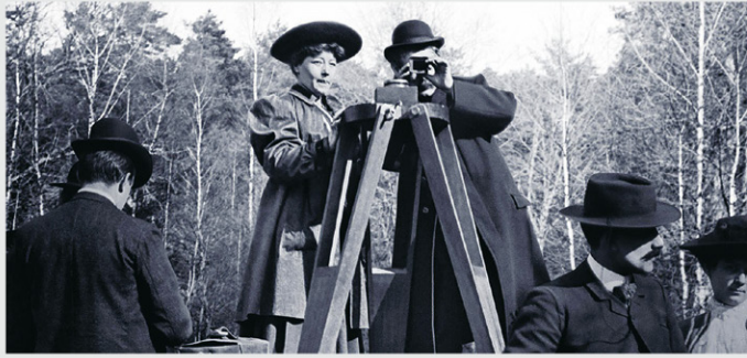
La importancia de Lois Weber, casi siempre ignorada, desafía a las historias tradicionales del cine.