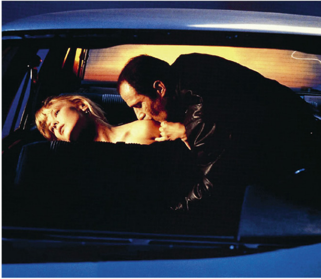
Crash (1996), de David Cronenberg, es uno de los ejemplos de la compleja relación entre el cine y la censura.

«NO QUIERO ENSEÑAR LAS COSAS, SINO PROVOCAR EN LA GENTE EL DESEO DE VER».