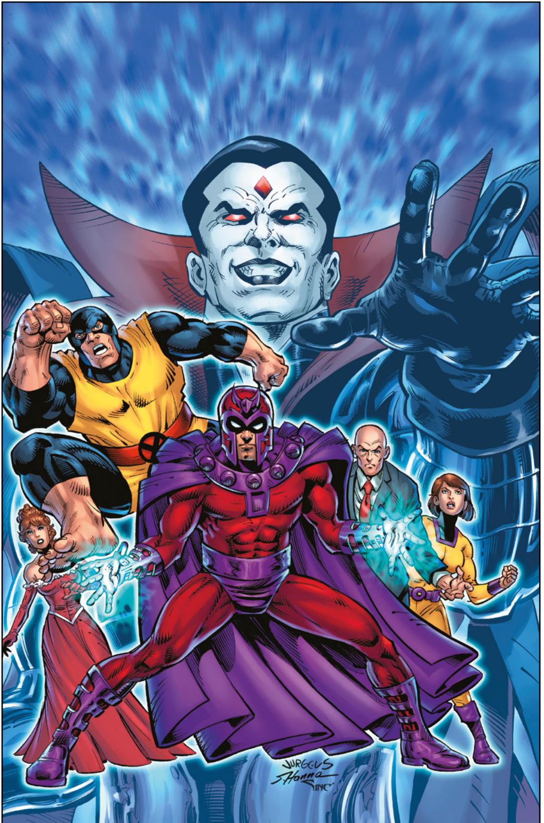
X-Men Legends (2021) 10 Cover von DAN JURGENS